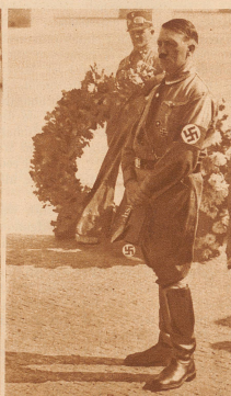
Adolf Hitler, der Führer der Nationalsozialisten, die sich jetzt in zwei Lager (Stennes und Hitler) gespalten haben, beim Reichsparteitag in Nürnberg