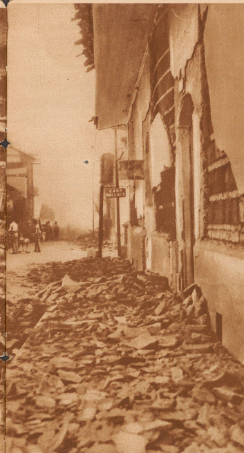
Nicht eingestürzte Häuser wurden derart beschädigt, daß sie eine ständige Gefahr für die Bevölkerung bilden. Der angerichtete Schaden wird auf 350 Millionen Franken geschätzt

verwandelte die Hauptstadt Managua in eine Stätte des Grauens. Die Zahl der Todesopfer beläuft sich auf gegen 3000 und ist nur deshalb nicht größer, weil sich fast die Hälfte der Bevölkerung zur Zeit der ersten Stöße am Meer befand. Alle Bahnlinien sind in einem Umkreis von 15 km zerstört, was das Rettungs- und Hilfswerk sehr erschwert