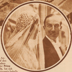
Der Anwärter auf den französischen Thron, der Prinz von Paris, hat sich mit der Prinzessin Isabelle von Orleans in Palermo vermählt