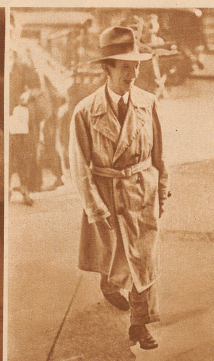
Im Zusammenhang mit dem Stennes-Konflikt ist Dr. Hermann Goebbels für den Gau Berlin von Adolf Hitler außerordentliche Vollmacht erteilt worden