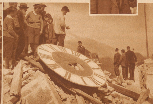
Eine große Menschenmenge wohnte dem Sterben der alten Kirche bei. Alt und Jung eilte dem Schauplatz zu, als sich die Staubwolke über den Trümmern der Kirche langsam verzog