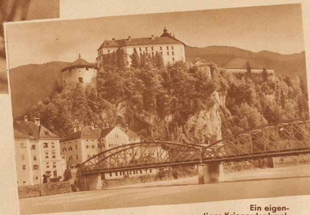
Ein eigenartiges Kriegerdenkmal.

Im runden Turm (links im Bilde) der Feste Geroldseck, am Stadteingang von Kufstein im Tirol wird zurzeit eine Riesenorgel mit 1813 Pfeifen und 26 Registern zum Gedächtnis der im Weltkrieg gefallenen Deutschen und Oesterreicher eingebaut. Der Ertrag der Konzerte, die außer im 1000 Personen fassenden Konzertsaal in kilometerweiten Umkreis gehört werden können, soll der Kriegsblinden-Fürsorge Deutschlands und Oesterreichs zugute kommen