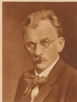
Der Beethoven-Preis für das Jahr 1931 in der Höhe von 10000 Mark ist von der preussischen Akademie der Künste dem Komponisten und Dirigenten Prof. Hans Pfitzner verliehen worden