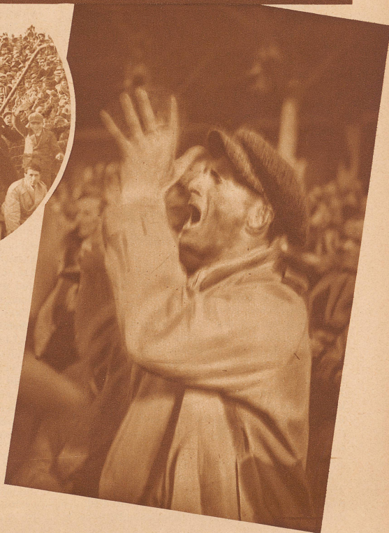
Bild rechts: Italia!! Italia!! Kurz vor Spielschluß kam der Ausgleich: Tor für Italien