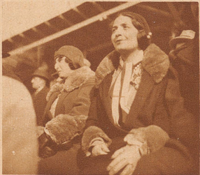
Man bemerkte in der Zuschaueremenge manche schöne italienische Frau, die dem Spiel mit besonderer Hingabe und Anteilnahme folgte

Die Italiener glänzen durch intelligentes und diszipliniertes Zusammenspiel. Pasche, der Schweizer Torwart, ist aber auf der Hut. Wir sehen ihn hier bei einer seiner ausgezeichneten Abwehrtaten