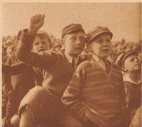
Die Berner Buben waren auch tüchtig bei der Sache. Sie schimpften, wenn etwas fehlging und schrien, wenn's geriet. «D'Schwiz isch guet», meinten sie