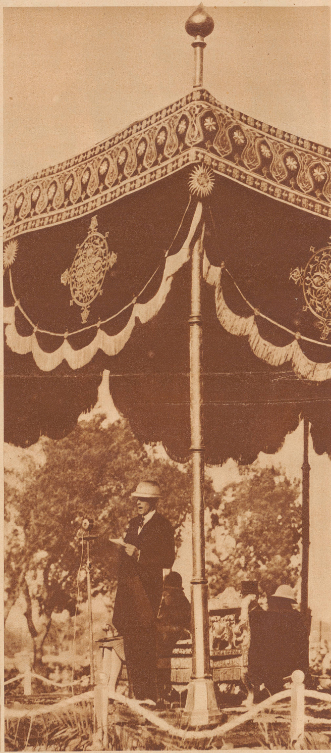
Lord Irvin , der Vizekönig von Indien, spricht durch das Mikrophon zu Tausenden geduldig zuhörenden Indern. Ihm ist der große Wurf gelungen, der Friedensvertrag mit Gandhi, dem ungekrönten König. Trotzdem ist die definitive Selbständigwerdung Indiens nur noch eine Frage von Jahren

Die «Zürcher Illustrierte» erscheint Freitags • Schweizer Abonnementspreise: Vierteljährlich Fr. 3.30, halbjährlich Fr. 6.30, jährlich Fr. 12.—. Bei der Post 30 Cts. mehr. Postscheck-Konto für Abonnements: Zürich VIII 3790 • Auslands-Abonnementspreise: Beim Versand als Drucksache: Vierteljährlich Fr. 4.50 bzw. Fr. 5.25, halbjährlich Fr. 8.65 bzw. Fr. 10.20, jährlich Fr. 16.70 bzw. Fr. 19.80. In den Ländern des Weltpostvereins bei Bestellung am Postschalter etwas billiger. Insertionspreise: Die einspaltige Millimeterzeile Fr. —.60, fürs Ausland Fr. —.75; bei Platzvorschrift Fr. —.75, fürs Ausland Fr. 1.—. Schluß der Inseraten-Annahme: 14 Tage vor Erscheinen. Postscheck-Konto für Inserate: Zürich VIII 15769