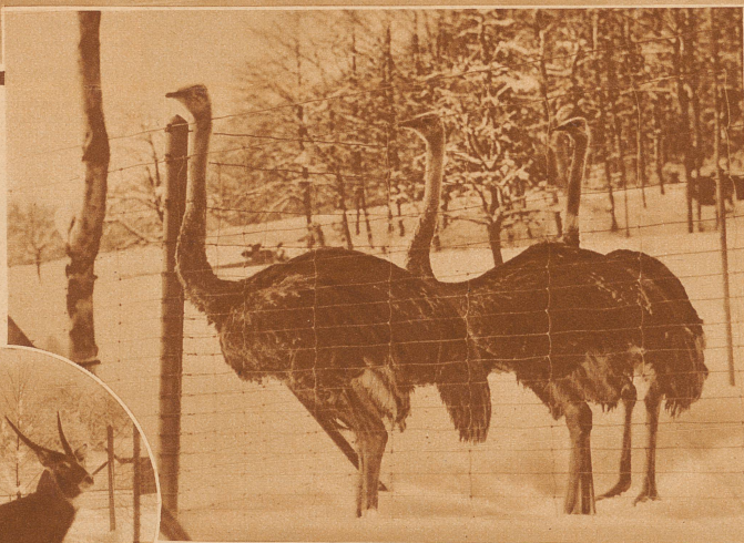
Bild rechts: Bald haben die Strauße längs dem Gitter den schönsten Weg getreten und stolzieren, ohne zu frieren, im ganzen Gehege herum