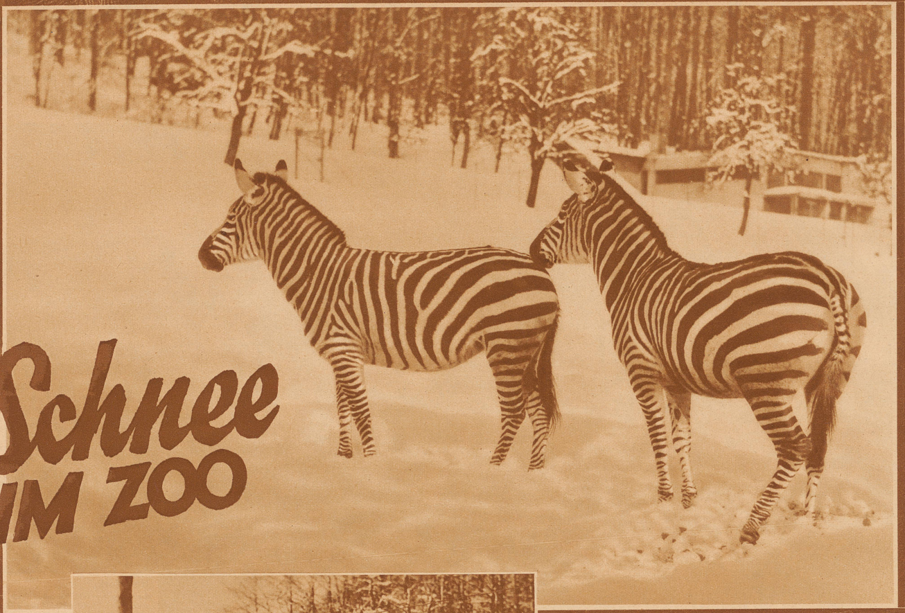
Schön sind diese Zebras, ganz besonders wenn sie im Uebermut durch das Schneefeld galoppieren

Bild rechts: Bald haben die Strauße längs dem Gitter den schönsten Weg getreten und stolzieren, ohne zu frieren, im ganzen Gehege herum