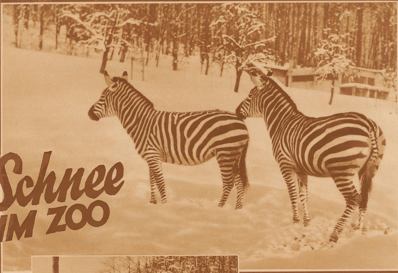
Schön sind diese Zebras, ganz besonders wenn sie im Uebermut durch das Schneefeld galoppieren

Bild rechts: Bald haben die Strauße längs dem Gitter den schönsten Weg getreten und stolzieren, ohne zu frieren, im ganzen Gehege herum