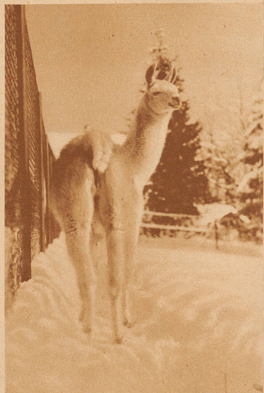
Weiß in weiß. Beinahe übersieht man das Lama

Man sollte vermuten, daß der viele Schnee dieses Winters den an wärmere Zonen gewöhnten Tiere des Zürcher Zoo arg zusetzt hätte. Das war aber durchaus nicht der Fall. Wie die Schulbuben begrüßten sie den Schnee in ihren Gehegen. Ob von der Freude am Wintersport auch schon etwas auf sie übergegangen ist? Sie kamen erst vorsichtig aus dem Stall, schnuperten, äugten, um so erst mal den Schnee kennen zu lernen. Aber dann ging's los: prachtvolle Freuden sprünge bei den Antilopen, tolles Jaggen bei den Zebras, freudiges Trompeten und Schneeballenwerfen bei den Elefanten. Die jungen Tiger schlittelten und purzelten im Schnee herum wie ausgelassene Buben. Nur allmählich beruhigten sie sich und genossen dann die fremde weiße Landschaft ihrer Umgebung in stiller Beschaulichkeit. Jedes Tier war glücklich auf seine Art und wollte bei diesem Fest den ganzen Tag im Freien bleiben.