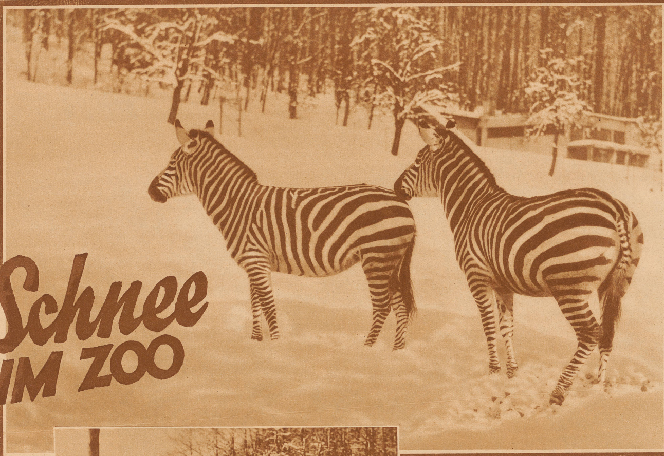
Schön sind diese Zebras, ganz besonders wenn sie im Uebermut durch das Schneefeld galoppieren

Bild rechts: Bald haben die Strauße längs dem Gitter den schönsten Weg getreten und stolzieren, ohne zu frieren, im ganzen Gehege herum