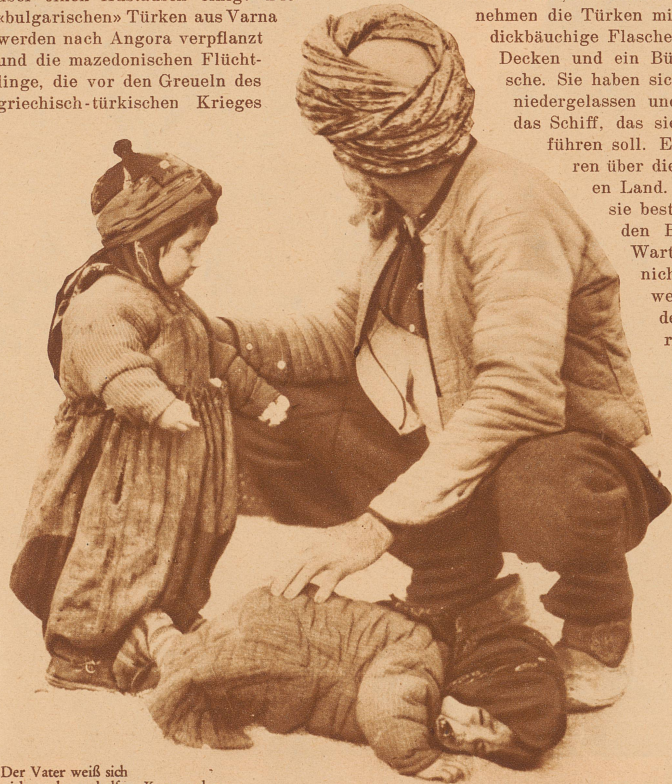
Der Vater weiß sich nicht mehr zu helfen. Kommt denn das Schiff noch nicht, auf dem er endlich seine Kinder zur Ruhe bringen könnte?

etwas zaghaft ein kaum neunjähriges Mädchen. Gesang ertönt. Die Anker werden gelichtet. — Das Auswandererschiff verschwindet ganz allmählich am Horizont.