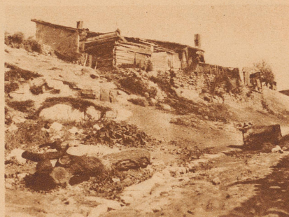
Verlassen stehen die Hütten im Türkenviertel von Varna und warten in romantischer Verwahrlosung auf ihre neuen Bewohner, die mazedonischen Flüchtlinge

etwas zaghaft ein kaum neunjähriges Mädchen. Gesang ertönt. Die Anker werden gelichtet. — Das Auswandererschiff verschwindet ganz allmählich am Horizont.