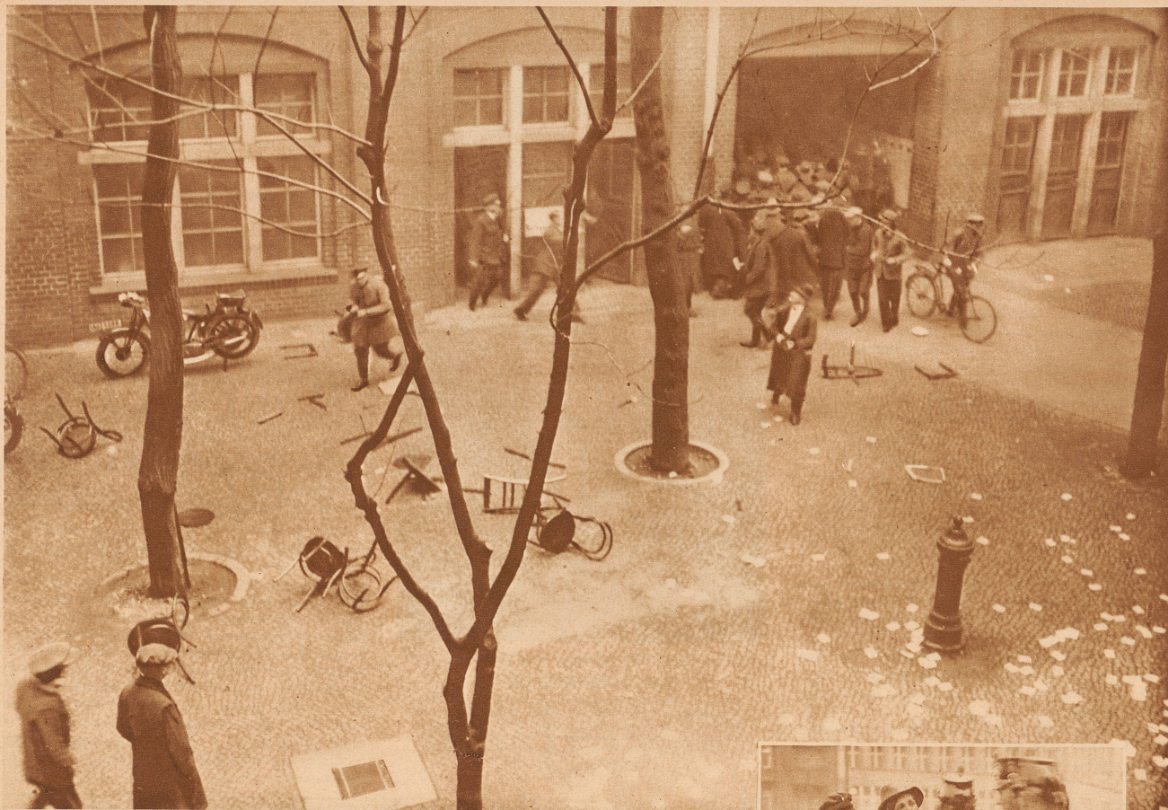
Der Hof des gestürzten Arbeitsnachweises unmittelbar nach den Unruhen