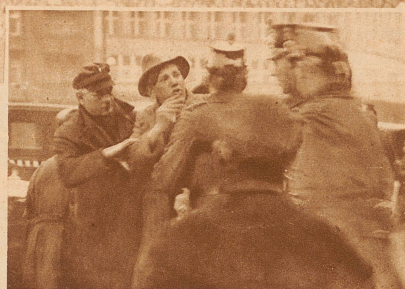
Ein Kommunist wird verhaftet

Städten Deutschlands jedoch, in denen die wirtschaftliche Not am krassensten fühlbar ist, kam es trotz strengem Demonstrationsverbot zu größeren Ausschreitungen, denen in Leipzig, Berlin und Halle mehrere Tote zum Opfer fielen. In Berlin wurden Lebensmittelgeschäfte geplündert und ein Arbeitsnachweis im Norden der Stadt gestürmt; das Mobiliar und die Arbeitslosenkartotheken wurden in den Hof geworfen. Nur mühsam gelang es der Polizei, mittels des Gummiknüppels der Lage Herr zu werden.