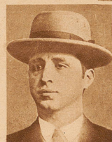
Rechts: Die beiden Hauptattentäter.