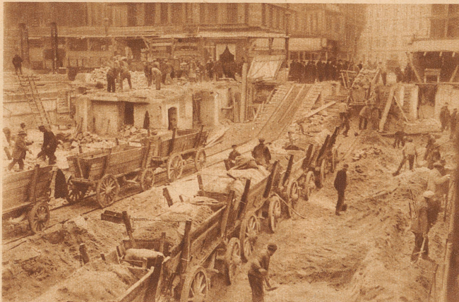
wurde eine Baustelle mit Schaufel, Wagen und Pferden ausgeschachtet. Ein Heer von Arbeitern war für die vielen einzelnen Manipulationen nötig