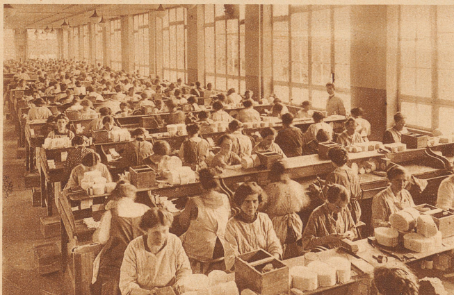
— das Bild datiert aus der Vorkriegszeit — wurden die Zigaretten von Hand gedreht und gestopft. Hunderte von Handarbeiterinnen hatten ihr sicheres Brot