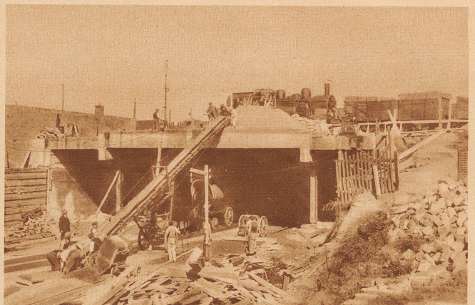
arbeitet man mit einer modernen Ausschachtungsmethode am laufenden Band, das direkt zu den Eisenbahnlöchern führt. Benötigte Arbeiter: Sechs