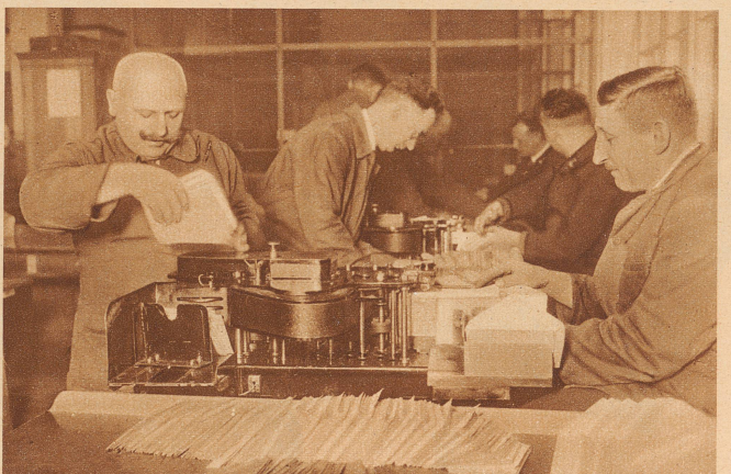
bringt eine moderne Briefschließ- und Stempelmachine täglich 60 000 Briefe fertig zum Versand. Sie wird von zwei ungelerten Arbeitern bedient