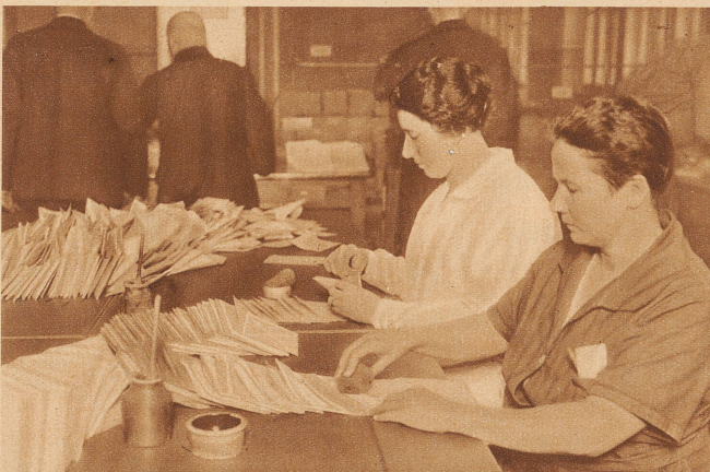
saßen im Postscheckamt Tausende Mädchen und Frauen, die die täglichen Briefe mit einem Schwamm anzufeuchten und von Hand zuzumachen hatten