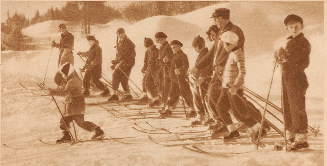
Aufnahme aus der Ski-Schule J. Dahinden