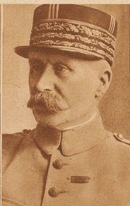
Marshall Pétain war in den letzten Jahren Oberbefehlshaber der französischen Armee. Er ist jetzt von seinem Posten zurückgetreten, um der Kommission für die Verteidigung Frankreichs gegen Luftangriffe seine Dienste als Vorsitzender ungehindert widmen zu können