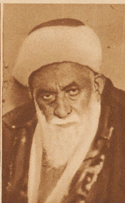
Anfangs Februar wurden in Menemen bei Konstantinopel 28 Türken, die gegen die türkische Republik eine Verschwörung angesetzt hatten, gehängt. Der 93-jährige Scheik Esai , das Haupt der Verschwörung, starb vor der Hinrichtung an einem Herzschlag im Gefängnis