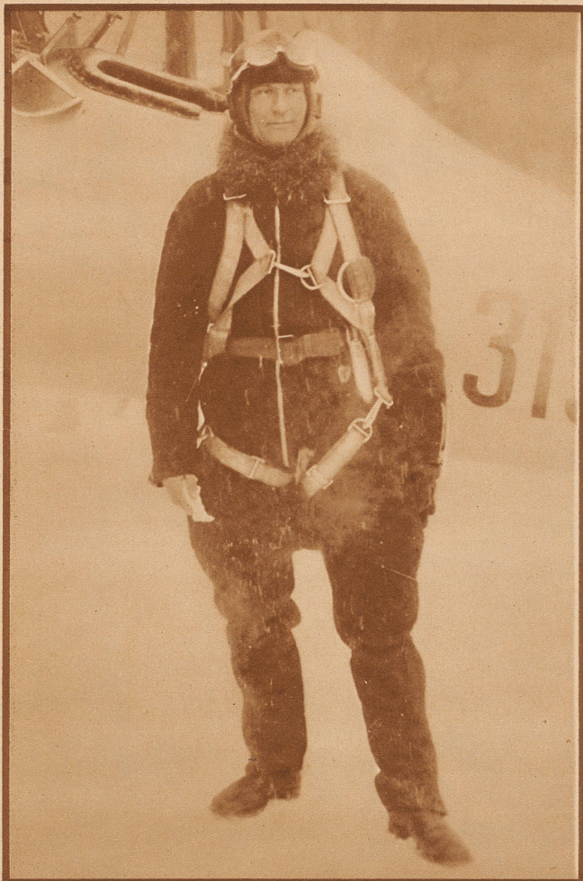
Der schwedische Fliegerhauptmann Einar Lundborg, der Retter Nobiles nach der Katastrophe der «Italia», verunglückte beim Einfliegen einer Maschine auf dem Flugplatz von Malmslätt tödlich