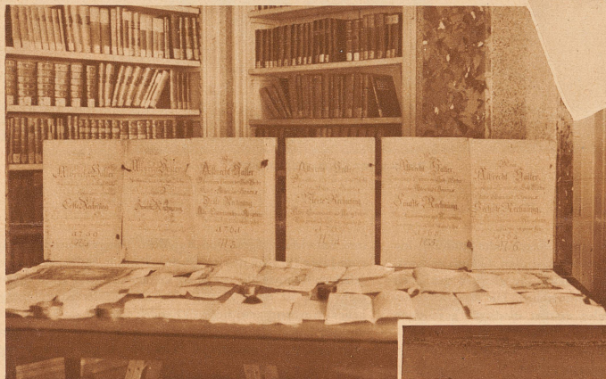
Auf dem Tische liegen die verschiedenen Diplome von Hochschulen und gelehrten Gesellschaften, welche Haller erhalten hat. Dahinter stehen die Jahresrechnungen der Bernischen Salzbergwerke zu Roche, Aigle und Bévieux, deren Direktor Haller von 1759 bis 1764 war

Der universellste Gelehrte, den unser Land bis heute hervorgebracht hat, war Albrecht von Haller. Er lebte 1708 bis 1777 und hatte schon im Alter von 19 Jahren an der berühmten holländischen Reichsuniversität zu Leyden den Dokortitel für Medizin erworben, unter dem weltbekannten Chirurgen Boérhave. Darauf bereiste er in seiner Heimat das Berner Oberland und seine Berge — damals noch etwas ganz Ungewohntes! — und schrieb dann das