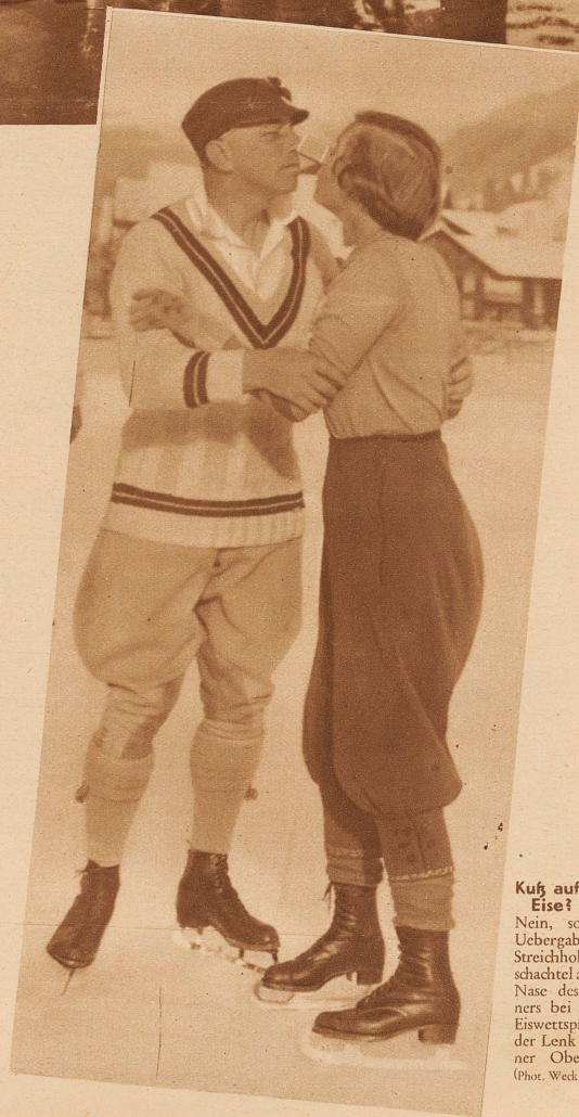
Kuß auf dem Eise?

Nein, sondern Uebergabe der Streichholzschachtel auf die Nase des Partners bei einem Eiswettspiel in der Lenk (Berner Oberland)