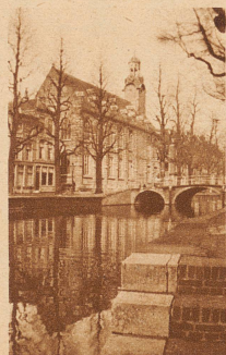
Die holländische Rijksuniversität zu Leyden, wo Haller studierte und im Alter von 19 Jahren das medizinische Doktor-examen bestand

Gedicht «Die Alpen», das ihm mit anderen Werken damals den Ruf des bedeutendsten deutschen Dichters eintrug. Seine Hauptarbeit aber lag auf wissenschaftlichem Gebiet, vor allem auf dem der Medizin und Naturgeschichte. Schon zu seinen Lebzeiten erschienen 205 Bände seiner Werke im Druck