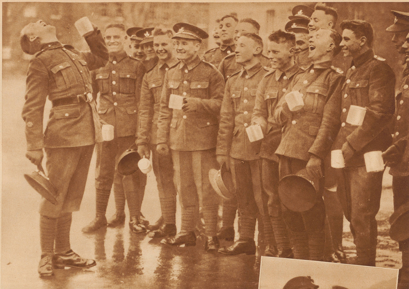
Der Unteroffizier zeigt den Rekruten, wie man gurgelt. Man versäumt bei den englischen Truppen nichts, um das Umsichgreifen der herrschenden Grippe zu verhindern