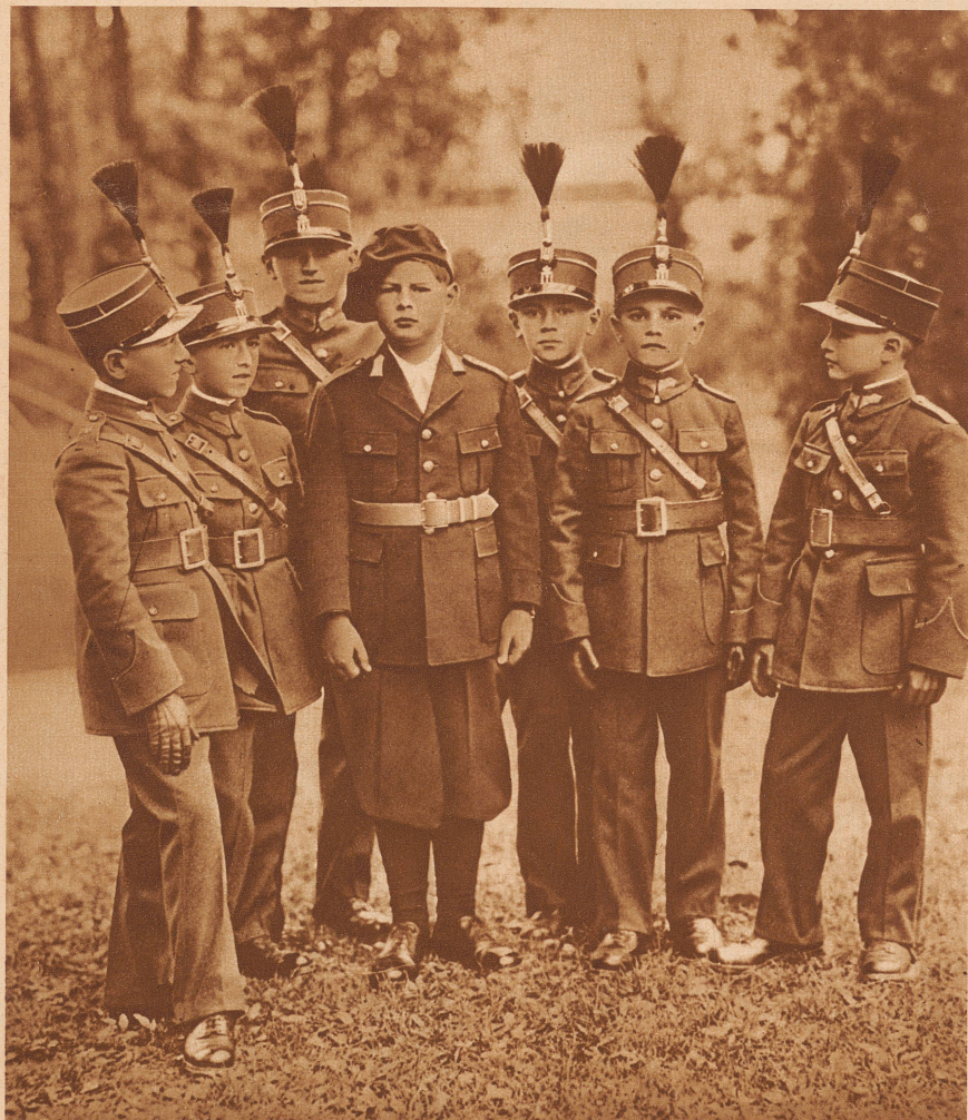
Der kleine Prinz Michael von Rumänien war ein ganzes Jahr lang König in seinem Land, bis sein Vater von Paris heimkam. Jetzt ist er wieder Kronprinz und muß warten, bis er groß ist, bevor er noch einmal König wird. Sein Bild kann man auf allen rumänischen Briefmarken sehen. Hier ist er zusammen mit seinen Klassenkameraden aus der Militärschule. Er muß riesig viel lernen, mehr als er gerne mag, denn er ist ein bißchen dick und faul und hochmütig