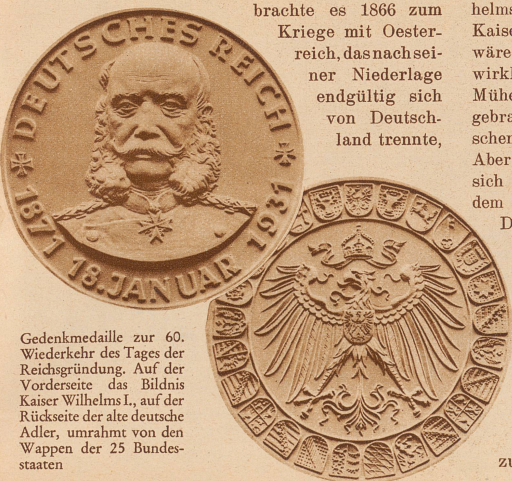
Gedenkmedaille zur 60. Wiederkehr des Tages der Reichsgründung. Auf der Vorderseite das Bildnis Kaiser Wilhelms I., auf der Rückseite der alte deutsche Adler, umrahmt von den Wappen der 25 Bundesstaaten

Aber die neue kaiserliche Majestät hatte ihren Zorn über Bismarck trotzdem noch nicht verwunden: als Wilhelm vom Podium der Fürsten herabstieg, da schritt er hoherhobenen Hauptes an seinem künftigen Reichskanzler vorbei, obwohl dieser allein auf dem freien Platze stand; den hinter ihm stehenden Generälen dagegen bot der Kaiser die Hand. — Erst nach mehreren Tagen kamen die gegenseitigen Beziehungen wieder ins alte Geleise.