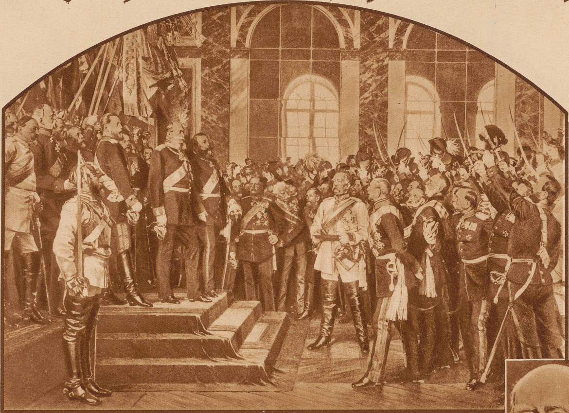
Die Proklamation König Wilhelms von Preußen zum Deutschen Kaiser im Schlosse zu Versailles am 18. Januar 1871