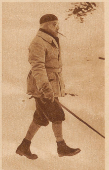
Der frühere französische Ministerpräsident André Tardieu erholt sich gegenwärtig in St. Moritz von den Staatsgeschäften