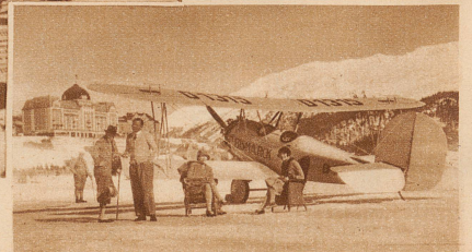
Rechts nebenstehend: Das Auto wird durch das Flugzeug überwunden. Ein Wochenendgast trifft mit seinem Sportflugzeug in St. Moritz ein