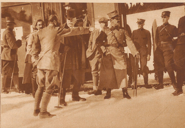
Während seines Aufenthaltes in der Schweiz im Jahre 1920 besuchte Marschall Joffre das militärische Skirennen der Besatzung von St. Maurice, das in Bretaye sur Villars ausgetragen wurde. Das Bild zeigt Joffre im Gespräch mit Oberstdivisionär Grosselin