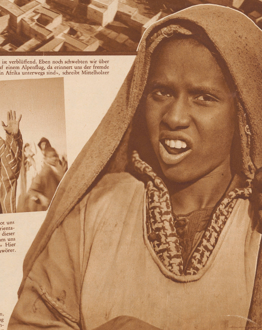
Berbermädchen, das keine Ahnung hat, was ein Zahnarzt ist