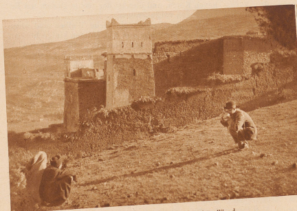
Eine Berberfestung im hohen Atlas; Kapitän Wood, der eine von Mittelholzers Begleitern, photographiert