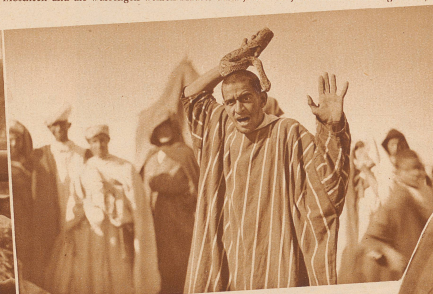
„Zwei Tage lang blieb das Wetter unbeständig, doch bot uns die Kameradschaft der französischen Flieger, sowie das orientalische, noch ganz unverfälschte Leben der Einwohner dieser ländlichen, noch ganz unverfälschte Stadt genügend Abwechslung, um uns großen marokkanischen Stadt genügend Abwechslung, um uns das Warten auf klaren Fliegerwetter leicht zu machen.“ Hier ein kleiner Ausschnitt vom Markt: Der Schlangenbeschwörer, ein kleiner Ausschnitt vom Markt: Der Schlangenbeschwörer.