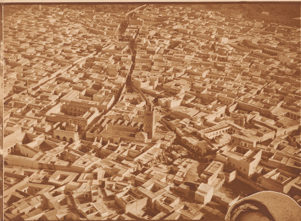
Marrakesch (Marokko). Blick aufs Zentrum der Stadt. „Die Nachbarschaft ist verblüffend. Eben noch schwebten wir über Schneebergen und Granitmassiven des Atlas, als wären wir unterwegs auf einem Alpenflug, da erinnert uns der fremde Blick auf Moscheen und die würfelförmigen weißen Häuser daran, daß wir ja in Afrika unterwegs sind“, schreibt Mittelholzer