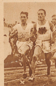
Der Franzose Ladoumègue (X) stellte im 1000 und 1500 m-Lauf mit 2 Min. 23,4 Sek. bzw. 3 Min. 49,2 Sek. neue Weltrekorde auf