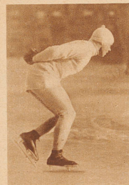
Thunberg, der schnellste Eisläufer. Mit 42,8 Sekunden hält er den Weltrekord im 500 m-Lauf