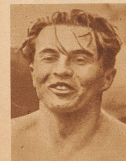
Ungarns Meisterschwimmer Barany schwamm 100 m in der neuen, europäischen Rekordzeit von 58,6 Sekunden