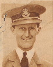
Orlebar, der schnellste Mann der Welt. Er erreichte mit dem Flugzeug die Rekordgeschwindigkeit von 575,7 km in der Stunde, was zweimal der Strecke Konstanz-Genf entspricht