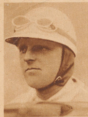
Major Segrave war mit 372,48 bzw. 158,8 Stundenkilometern der schnellste Automobil- und Motorbootfahrer. Er ist diesen Sommer bei einer Rekordfahrt im Motorboot tödlich verunglückt