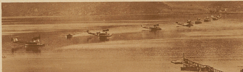
14 italienische Wasserflugzeuge im Hafen von Ortebello, von wo sie unter dem Kommando des Luftfahrtministers Balbo zum ersten Geschwaderflug nach Südamerika gestartet sind