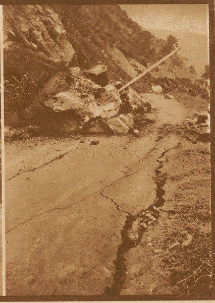
Bei Yugawara sind im Boden breite Risse entstanden