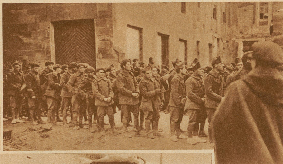
Soldaten des aufständischen Regiments Galicie nach der Entwaffnung durch die Regierungstruppen unter General Dolla