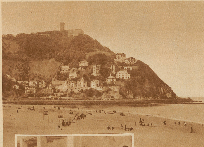
Blick auf den Badeort San Sebastian, wo die Aufständischen die Bureauxräume des Gouverneurs zerstörten