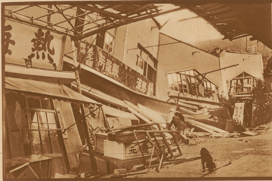
Straße in Mishima mit den zusammengestürzten Häusern. Bewohner, die das nackte Leben retten konnten, suchen die notwendige Habe unter den Trümmern hervor