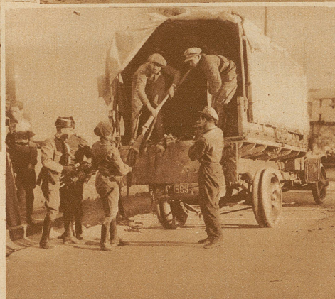
Links nebenstehend: Zivilgardisten beim Abtransport der den Rebellen in Madrid abgenommenen Waffen