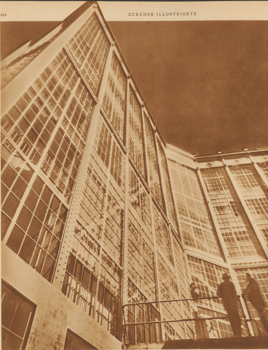
Ein Haus aus Stahl und Glas ist kürzlich in Worcester (U. S. A.) fertiggestellt worden. Auch nicht die kleinste Mauer ist zu sehen. Dadurch erhalten die Innenräume dieses reinen Zweckbaues, der deswegen nicht unschön zu sein braucht, eine bisher nicht gekannte Lichtfülle. Das Gebäude enthält die Verwaltungsräume eines großen Eisen- und Stahltrustes, der auf diese Weise für seine Produkte Reklame macht