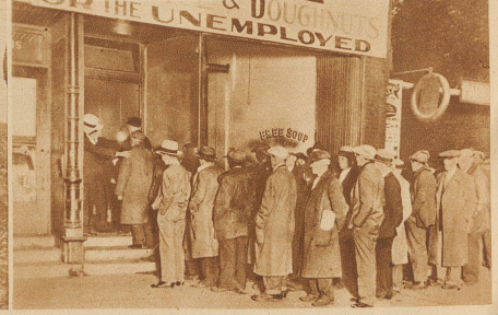
Der Schmugglerkönig als Wohltäter. Al Capone, Chicagos gefährlichster Bandenführer, hat eine Suppenküche eingerichtet, in der 3500 Arbeitslose täglich kostenlos versorgt werden. Diese Propaganda kostet ihn täglich 3000 Dollar – aber sie scheint das wert zu sein. Das Bild zeigt, wie Arbeitslose vor einer der Suppenküchen Al Capones auf Eintritt warten