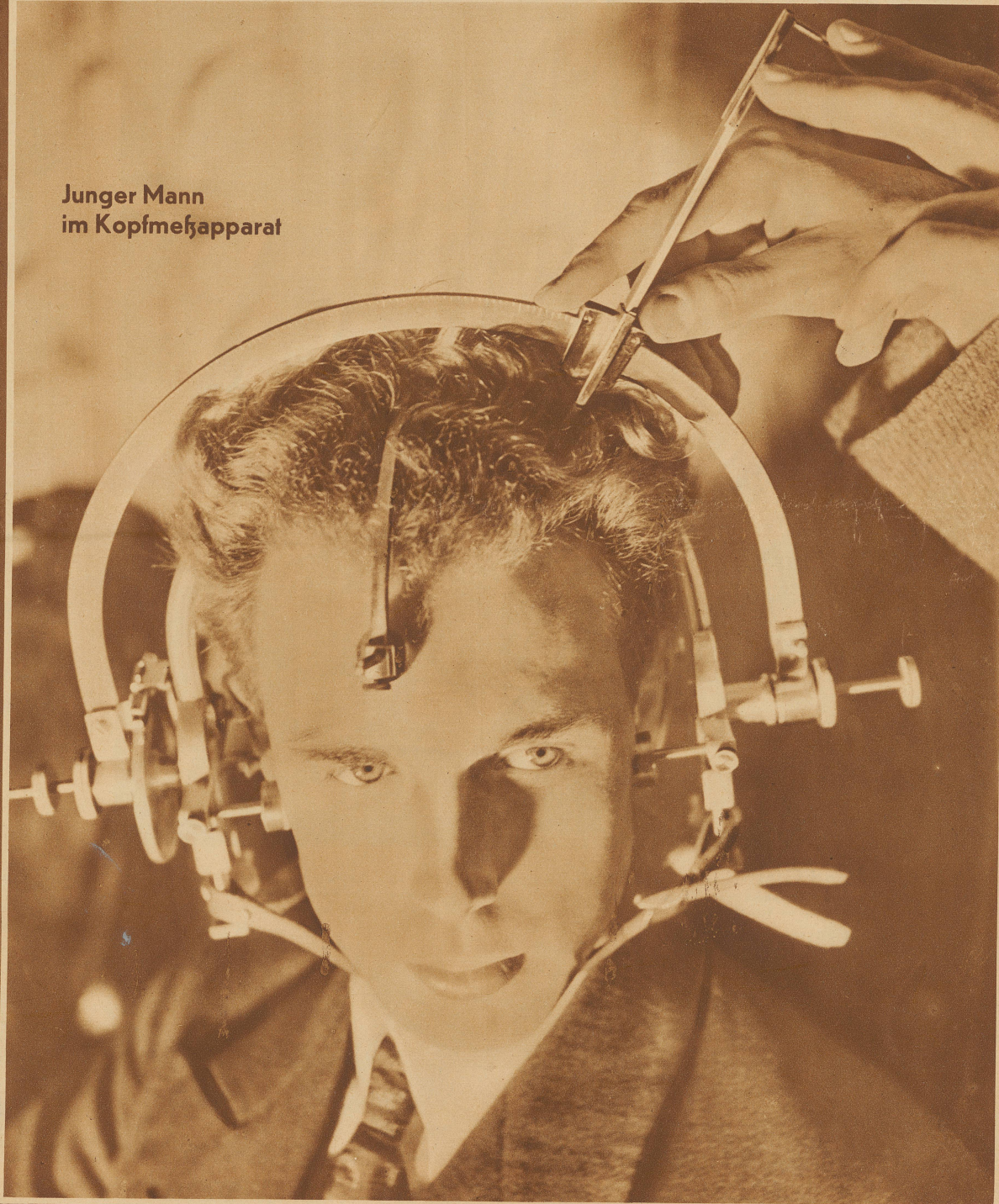
Junger Mann im Kopfmessapparat