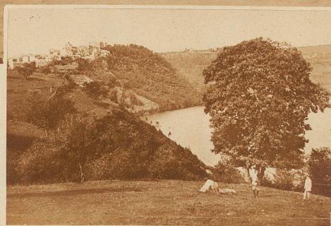
Landschaft am Nemi-See vor der Absenkung des Wasserspiegels. Der See hat einen Umfang von 5 1/4 km. Links oben das kleine Städtchen Genzano

Der römische Kaiser Caligula ließ in den Jahren 37—41 n. Chr. auf dem Nemi-See zwei gewaltige Schiffe bauen, von denen das eine als schwimmender Sommerpalast mit allem Prunk der damaligen Zeit ausgestattet war. Diese längst versunkenen Schiffe zu heben, hat sich die italienische Regierung zur Aufgabe gemacht. Schon 10 Monate, nachdem die Pumpen mit der Absenkung des Seespiegels begonnen hatten, lag das erste, in dreizehn Meter Tiefe ruhende Prunkschiff trocken. Wider alles Erwarten blieb die Ausbeute an antiken Kunstgegenständen gering. Neben wertvollen Marmor- und Holzfragmenten wurden nur einige Menschen- und Tierköpfe aus Bronze gefunden, ähnlich denjenigen, die schon im Jahre 1895 von Tauchern gehoben werden konnten und längst im Thermen-Museum in Rom aufgestellt sind. Dagegen ist die Freilegung des vorzüglich erhaltenen Schiffsrumpfes von großer Bedeutung, gibt er uns doch genaue Aufschlüsse über die altrömische Schiffsbaukunst, deren grundlegende Gesetze größtenteils auch heute noch Gültigkeit haben.