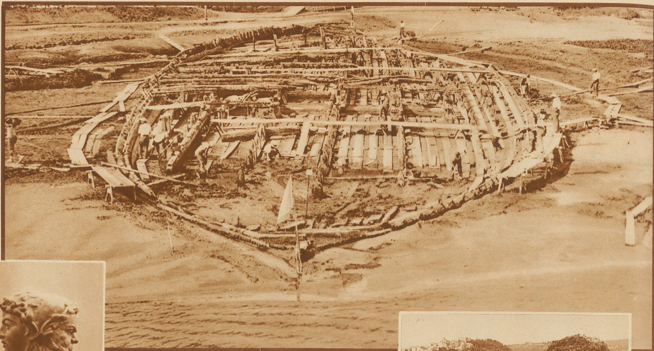
Der freigelegte Rumpf des bald 1900 Jahre alten Prunkschiffes Caligulas. Mit 64 Meter Länge und 20 Meter Breite hat das Schiff etwas ungewohnte Größenverhältnisse. Sie finden aber ihre Erklärung darin, daß es nicht zu Fahrten im eigentlichen Sinne des Wortes bestimmt war, sondern nur als schwimmender Palast zu dienen hatte