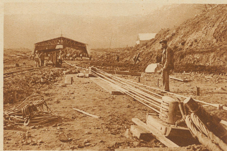
Das Schiff wurde auf Rollschlitten gesetzt und mit einem starken Flaschenzug 600 Meter weit auf eine Anhöhe transportiert, wo für seine Aufnahme ein eigenes Museum errichtet worden ist