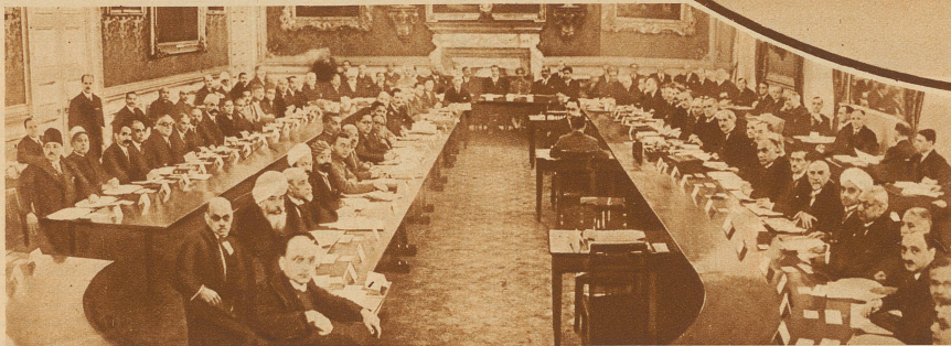
Die Round-Table Konferenz zwischen der englischen Regierung und den Vertretern Indiens im St. James-Palast in London. Auf der rechten Seite in der Mitte (etwas vorgelehnt) sitzt Ministerpräsident Ramsay Macdonald