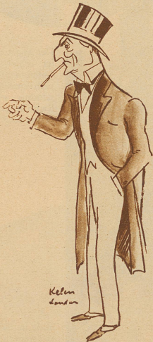
Links nebenstehend: Lord Reading, früher Vize-König von Indien, Vertreter der englischen Opposition an der Round-Table Konferenz