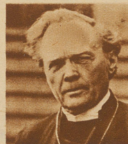
Bischof Söderblom, Primas der evangelischen Kirche Schwedens, der sich seit Jahren für eine Annäherung der Konfession einsetzt und unermüdlich gegen Chauvinismus und Nationalismus kämpft, ist mit dem Friedensnobelpreis für 1930 ausgezeichnet worden