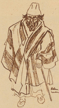
Mouhana Muhammed Ali, der als Führer der Mohammedaner und großer Gegner Gandhis an der Konferenz teilnimmt