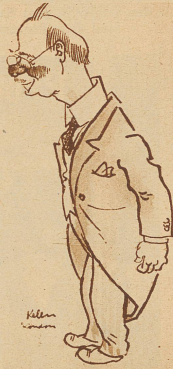
J. H. Thomas englischer Dominionminister