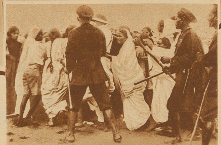
Die indische Regierung hat alle Veranstaltungen der Nationalisten verboten. Zum Protest gegen dieses Verbot zogen Hunderte von Anhängerinnen Gandhis mit der Nationalfahne durch die Straßen von Bombay. Sofort wurde die Eingeborenenpolizei eingesetzt, die zahlreiche Verhaftungen vornahm. Viele Frauen wurden verletzt