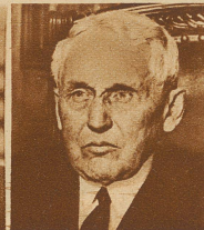
Der ehemalige amerikanische Staatssekretär Kellogg, der den nach ihm benannten Pakt zur Aechtung des Krieges entworfen hat, erhielt für seine Verdienste um den Weltfrieden den Friedenspreis für 1929