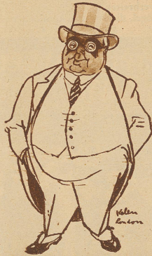
Der in England lebende indische Fürst Aga Khan, bekannt durch die großen Rennerfolge seiner Pferde, ist Vertreter aller Muselmanen