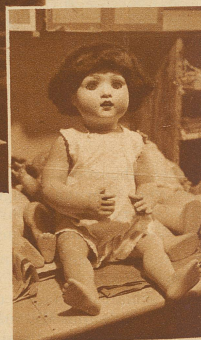
Bild rechts: Nach der Behandlung beim Doktor: ein gesundes Puppenkind