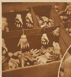
Hände, Hände, Hände und . . .

Dann sahen wir in dem großen Zimmer überall hoch aufgebeigte Schachteln herumstehen. Neugierig läpften wir den Deckel von der obersten und prallten zuerst erschrocken zurück — es war uns etwas unheimlich zumute: Da drin waren nichts als einzelne Hände, in allen Größen, in allen Farben; wir konnten ge-