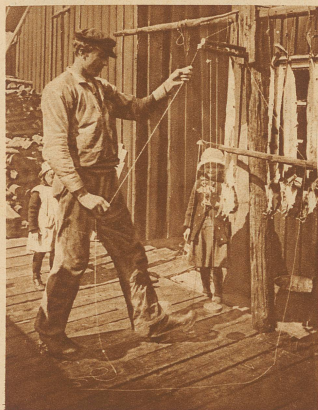
So werden die Stockfische zum Dörren in freier Luft aufgehängt

wird, geht in Spezialwaggons lebend nach Deutschland, der Schweiz und anderen Ländern, oder wird in den Fabriken zu Konserven verarbeitet — Wie fast alle großen industriellen Unternehmungen unserer Zeit ist auch der Lofotenfischfang vertrustet und befindet sich völlig in den Händen einiger weniger Großunternehmer. Die Fischer verrichten ihre Arbeit dabei auf eigene Rechnung und Gefahr, das heißt nicht diese, sondern die Masse des Fangs wird bezahlt. Immerhin rentiert sich die Sache doch derart, daß für den einzelnen dabei die hübsche Summe von 6000 Kronen pro Saison herauskommt, ein, an unsern Verdienstmöglichkeiten gemessen, riesiger Verdienst, der jedoch auch für die restlichen Monate des Jahres ausreichen muß, in denen die Fischer beschäftigungslos sind.