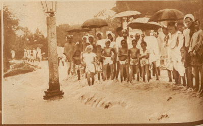
Auch Indien meldet große Ueberschwemmungen. Eingeborene durchwateten eine Straße, die eher einem Flusse gleicht