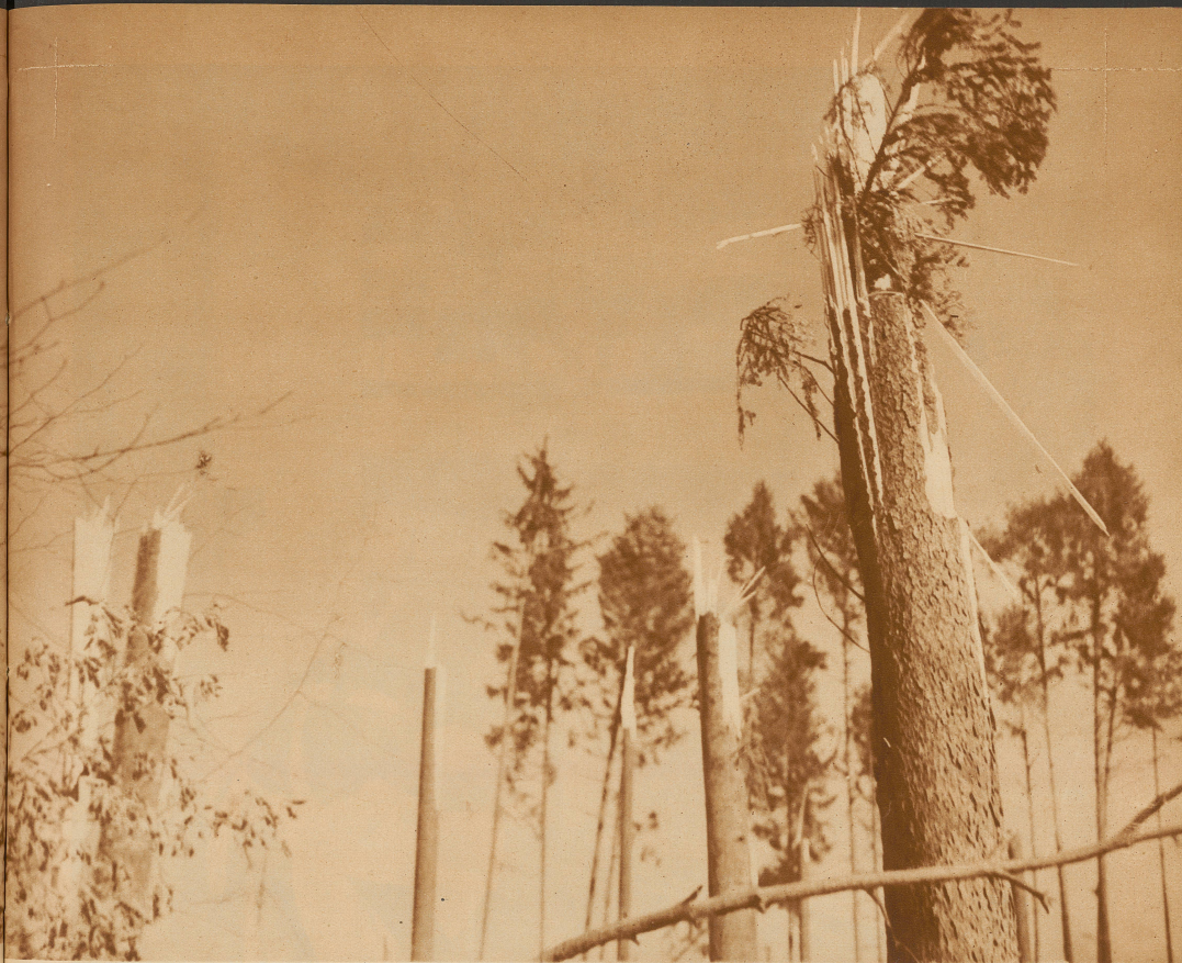
Die meisten Tannen wurden in halber Höhe geknickt. Der Wald sieht aus, wie wenn er durch ein Granatfeuer verwüstet worden wäre