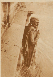
Hochwasser der Seine in Paris. Der populäre Zuave an der Almabridge steht bis zu den Knien im Wasser - doch er verliert seine Ruhe nicht