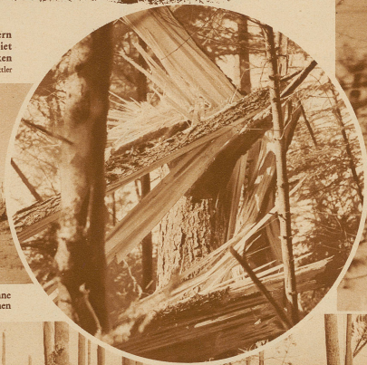
Rechts im Kreis: Eine 50 cm dicke Tanne wurde wie ein Zündholz abgebrochen