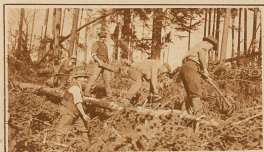
Hier führt eine Straße durch, die nun von Waldarbeitern wieder freigelegt wird