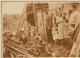
Vor dem Haus der Familie Roth in Hinter-Riedholz, auf das 13 Tannen geworfen wurden. Die acht schlafenden Kinder konnten nur durch ein Fenster gerettet werden