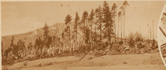
Der vom Sturm geknickte Wald von Riedholz. Nur einige wenige Tannen sind stehengeblieben