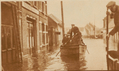
Uberschwemmung in Belgien. In Hoboken bei Antwerpen müssen die Leute mit Schiffen aus den bedrohten Häusern gerettet werden