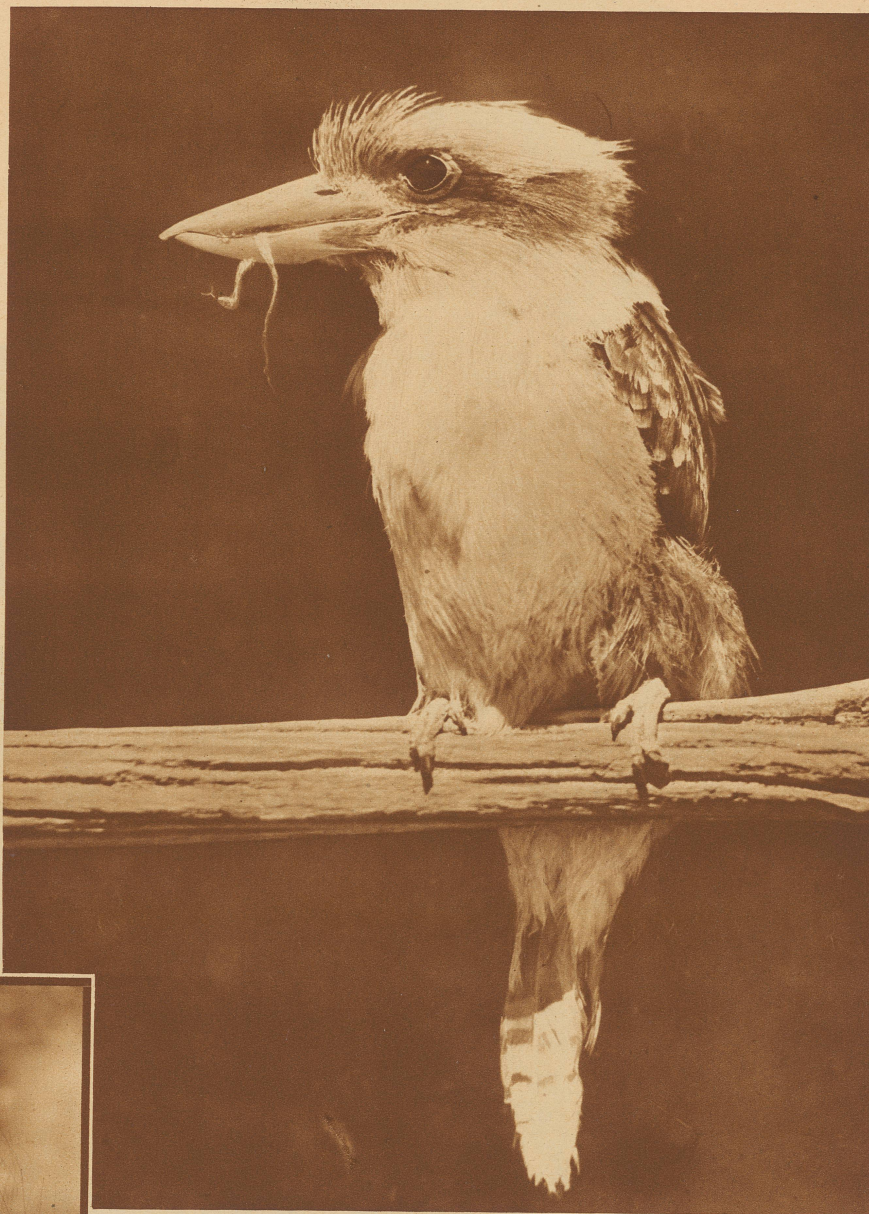
Der Jägerliest oder «Lachende Hans», der lachen kann wie ein Mensch

so stark und so grundsätzlich, daß sie es nicht einmal für kurze Zeit miteinander aushalten, und so verläßt die junge Frau Nest und Gatten, dem sie auch das Brüten überläßt.