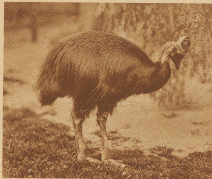
Der streitsüchtige Helmkasuar