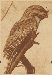
Bild rechts: Der Riesenschwalm, häufig auch Totenvogel genannt, weil er nachts mit Vorliebe auf den Friedhöfen herumstreicht

Der Helmkasuar ist einer dieser Einsamen. Seine kleinen, kalten Augen blicken feindselig in die Welt aus einem Gesicht, das aussieht, als ob es vor Aerger grün und blau geworden wäre. Seine kurzen schwarzen Federn hängen straff an seinem plumpen Körper hinunter. Seltsam wie das Aussehen der Kasuare ist auch ihr Leben. Sie sind nicht nur menschen-, sondern auch artscheu und gehen jedem Lebewesen aus dem Wege. Ihre Art, Fische zu fangen, ist ganz merkwürdig. Der Helmkasuar sucht Flußstellen auf, in denen das Wasser mindestens einen Meter tief ist. Dort taucht er unter, indem er seine Beine unter sich zusammenklappt, spreizt seine Federn und verharret so regungslos. Nach einer