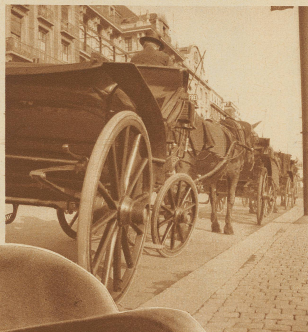
Auch sie spüren die Wirtschaftskrise. Stundenlang kommt kein Fahrgast, der noch Zeit hat, im Schritt oder Trab die Stadt zu besichtigen