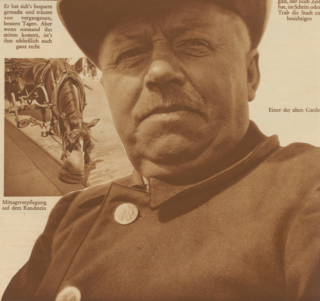
Einer der alten Garde