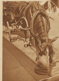
Mitagsverpflegung auf dem Randstein

Du guetti alti Basler Drotschgiézyt — Me merget's als meh: Dy Aend isch nimme wyt! Verby isch bald dy letzi Herligkait Und — 's Auto macht statt dir sich digg und brait!