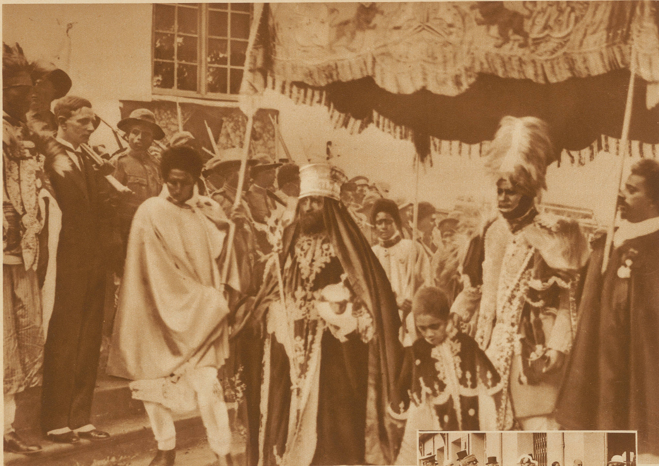
Die Krönungsprozession in Addis Abeba. Im Vordergrund Negus Tafari, der mit der Krönung den Namen Hayle Selassie angenommen hat. Neben ihm sein jüngster Sohn und ein hoher Würdenträger