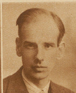
Ingenieur Harold Zangger wurde vom Bundesrat zum Vize-Direktor des Eidg. Amtes für Elektrizitätswirtschaft gewählt