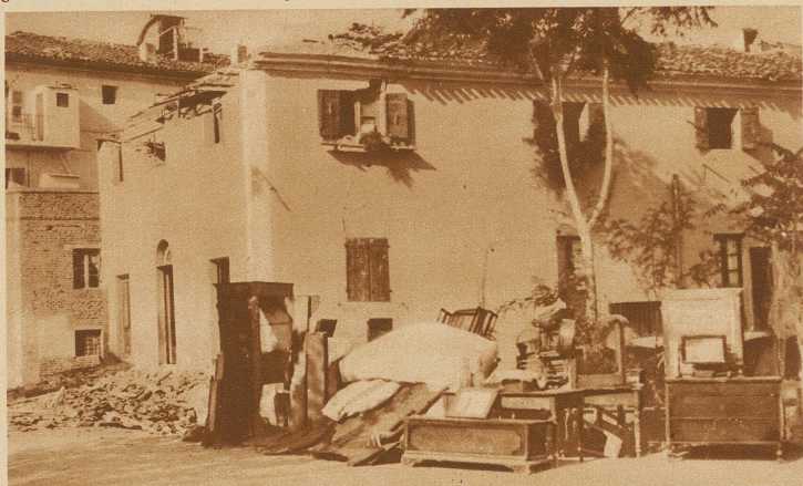
Italien ist von einem neuen Erbeben heimgesucht worden. Am meisten hat diesmal das Gebiet um das Städtchen Ancona an der Adria gelitten. Ancona selber wurde grösstenteils zerstört. Hunderte von Häusern sind dem Einsturz nahe und mußten geräumt werden. Die Habe steht auf der Straße, bis die Vertriebenen eine neue Heimstätte gefunden haben