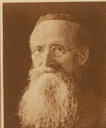
Dekan Traber in Bichelsee (Thurgau), der Begründer der schweiz. Raiffeisenbewegung, einer namentlich in der Ostschweiz stark verbreiteten Organisation bäuerlicher Selbsthilfe, ist 77 Jahre alt gestorben