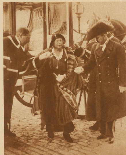
Frau Alexandra Kollontaj, die neue sowjetrussische Gesandte in Stockholm, ist im Galawagen des Königs abgeholt worden, und begibt sich zur Ueberreichung ihres Beglaubigungsschreibens ins königliche Palais