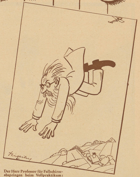
Der Herr Professor für Fallschirmabspringen beim Vollpraktikum: «Wirklich ärgerlich! Nun habe ich meinen Fallschirm schon wieder vergessen!»

«Wenn doch alle Zimmer Ihres Hotels gleich sind, woher kommt es denn, daß Sie für die einen sechs und für die anderen sieben Franken verlangen?» Portier: «Ich will es Ihnen sagen, Herr. In diejenigen für sieben Franken stellen wir über Nacht eine Mäusefalle.»