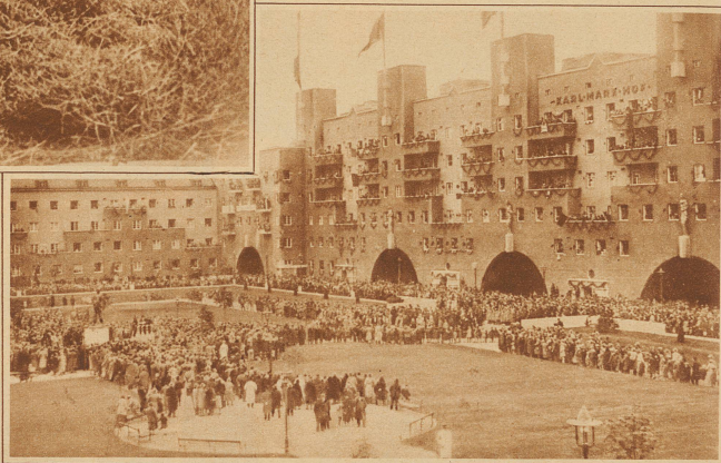
Einweihung des Karl Marx Hofes, eines riesigen Gebäudekomplexes im Wiener Stadtviertel Heiligenstadt. Der festungsähnliche Bau enthält Hunderte von Arbeiterwohnungen