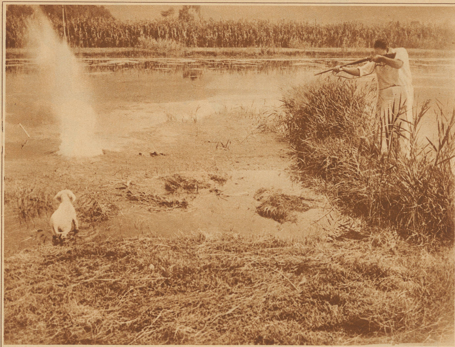
Fische werden geschossen. Dieser eigenartige Sport ist hauptsächlich in Italien weit verbreitet. Der Schütze braucht den Fisch nicht direkt zu treffen, es genügt, wenn das Geschöß in unmittelbarer Nähe einschlägt. Der durch den Einschlag verursachte Wasserdruk bringt die Schwimmblase des Fisches zum Platzen oder lähmt sie wenigstens derart, daß er nicht mehr schwimmen kann. Der Hund hat dann leicht, die Beute zu apportieren