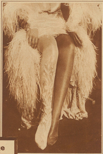
Das heutige Selbstbild

...gt den großen Oland aus unserem man «Aufuhr um by» — dazu das strät der schönen stokratin Gaby d dasjenige ihres beters und Man-, des Petrolgewal-