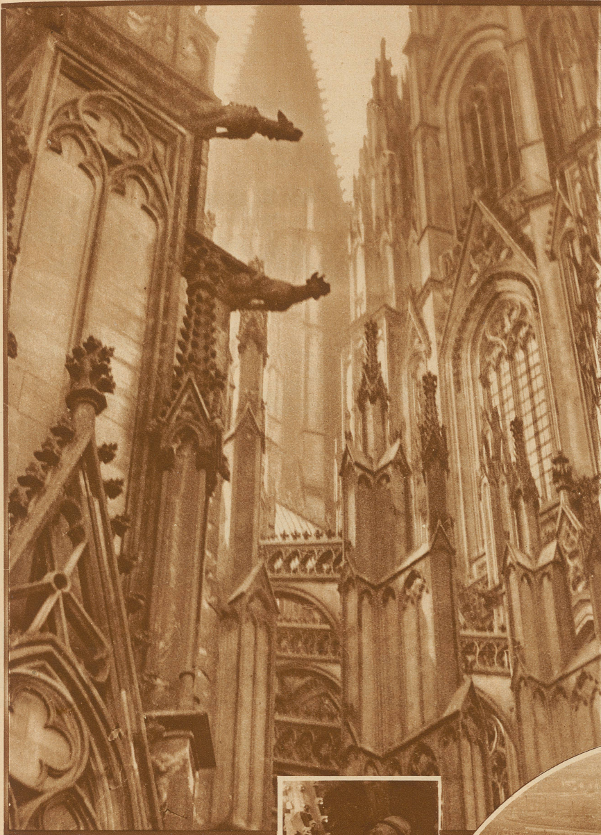
Die Türme des Kölner Domes in der Morgensonne