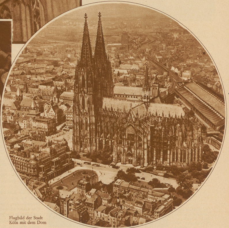
Flugbild der Stadt Köln mit dem Dom