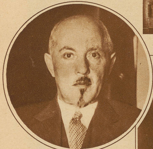
Chintschuk der neue russische Botschafter in Berlin und Nachfolger Krestinskis