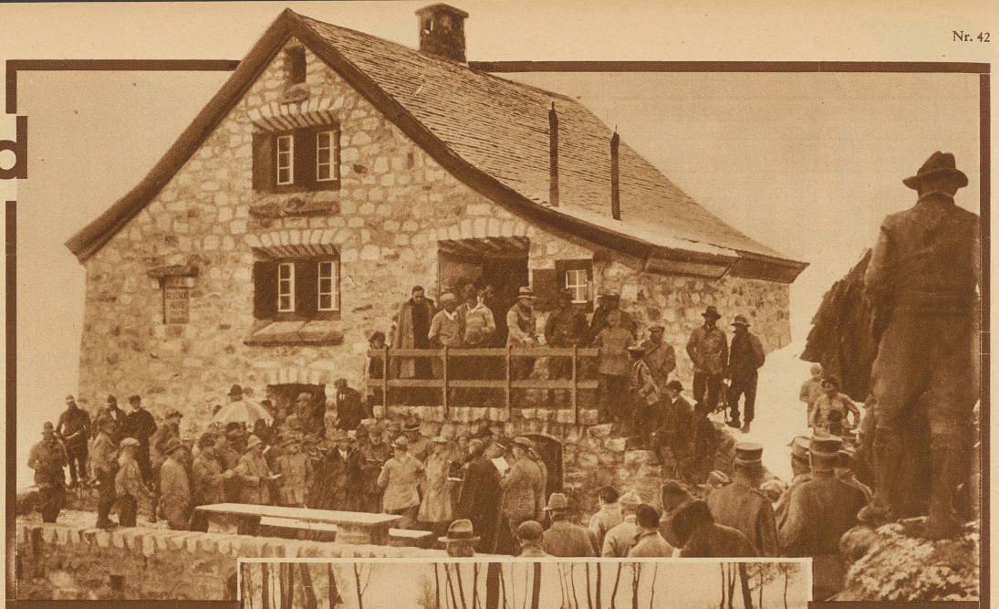
Bild rechts: Hüttenweihe mit Schneegestöber Ueber 200 Klubmitglieder stiegen im Gotthardgebiet bei heftigem Schneegestöber nach der Rotondalhütte hinauf. Die Sektion Lägern des S. A. C. hatte zur Einweihung der neuen Hütte eingeladen. An die Stelle des alten Holzhauses ist ein fester geräumiger Steinbau getreten.