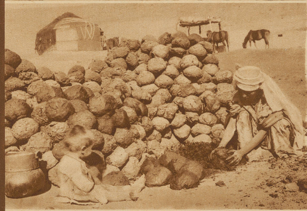
Die Temperatur sinkt in der Kirgisensteppe In den weiten Flächen südlich vom Ural gibt's kein Holz und keine Kohle. Der Kirgise sammelt den Mist seiner Tiere und trocknet ihn im Sommer in großen Ballen, damit heizt er im Winter seine Hütte