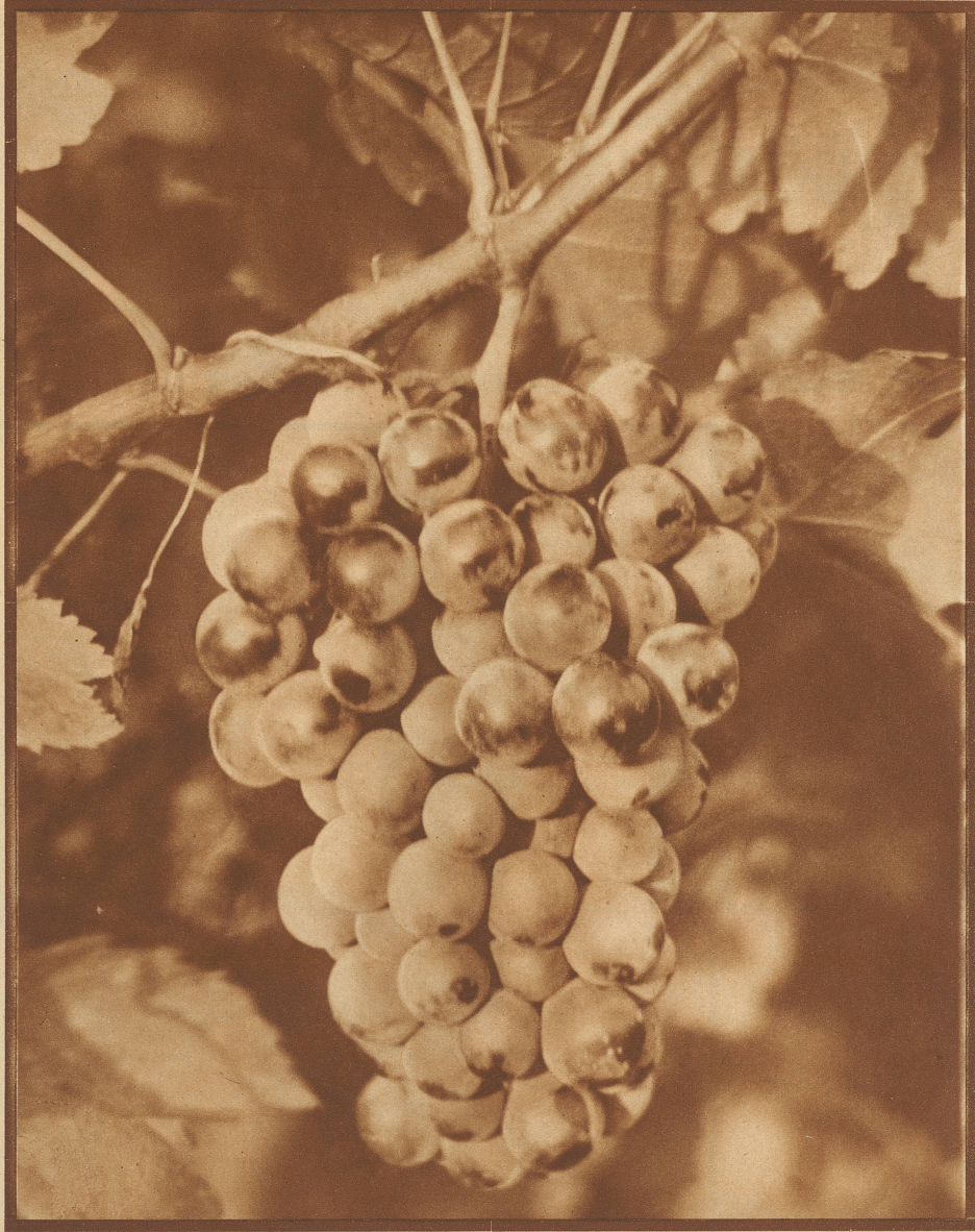
IM DUNKEL DES REBLAUBS