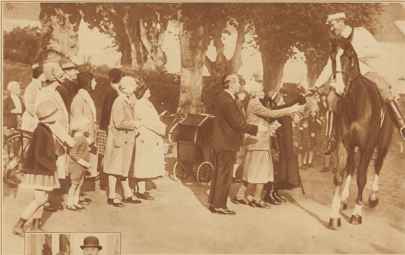
Er dankt seinen Gratulanten. König Christian von Dänemark ist 60 Jahre alt geworden. Auch an seinem Geburtstag ist der tägliche Morgenritt nicht ausgefallen und die Kopenhagener, die zu der Zeit auch gerade unterwegs waren, hatten Gelegenheit, die königliche Hand zum Glückwunsche zu drücken.