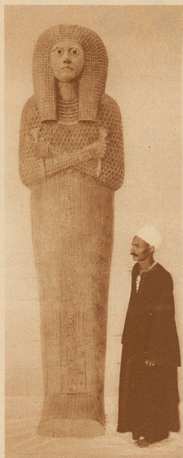
Der äußere Sarg mißt über 3 m