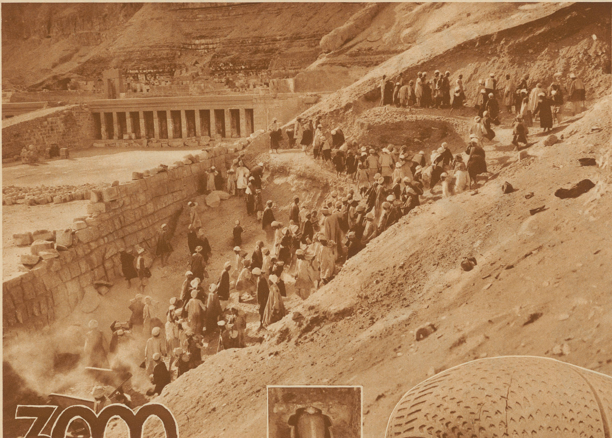
Der Wall des Tempels der Hatschepsut (Theben) wird auf der Außenseite freigelegt. Hier fand die Expedition ein großes Grabgewölbe mit dem Sarg der Königin Meryet-Amün