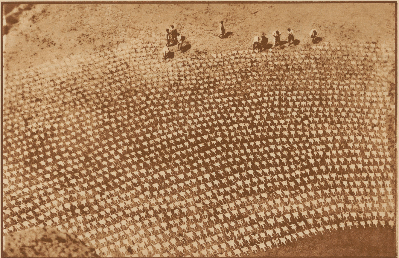
Was mag das sein?

Schaffelle, die zum Trocknen ausgelegt sind. — Aufnahme aus einer großen Schafzucht in Zentralasien