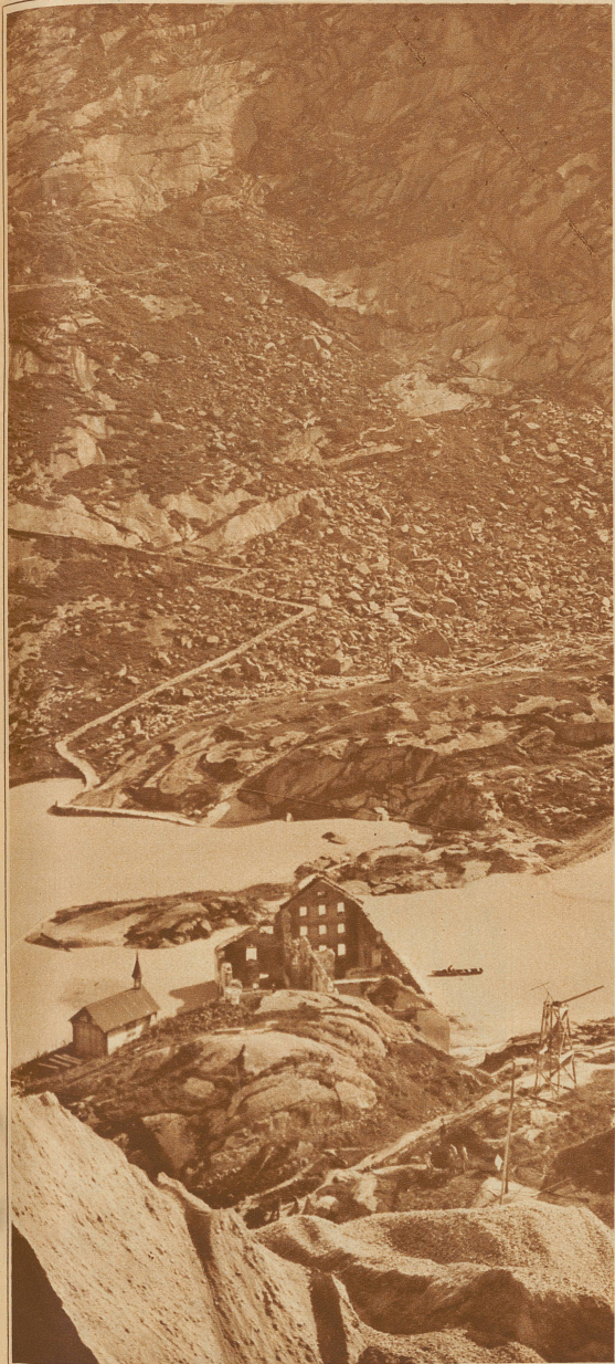
Blick vom Nollen auf die Ruine und die alte Grimselstraße