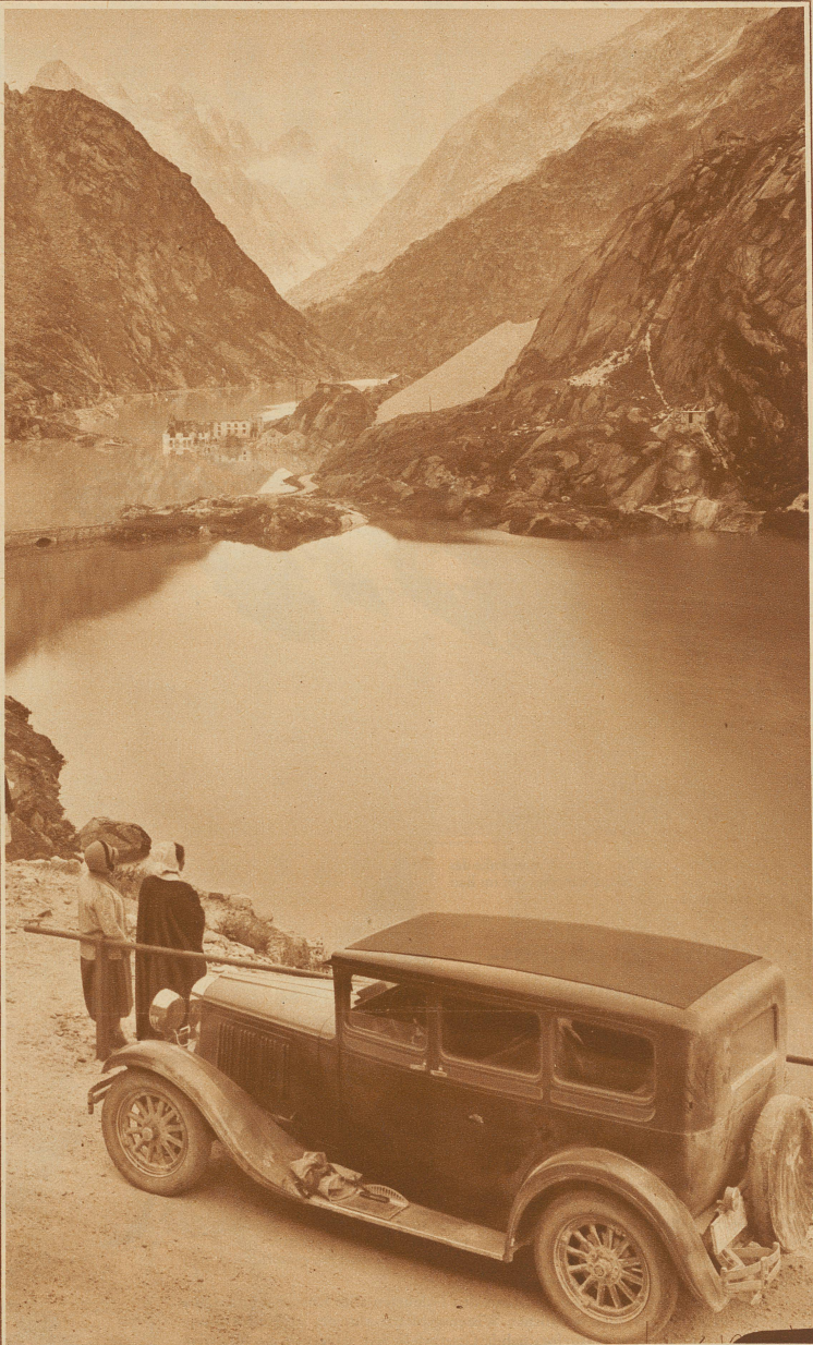
Der vordere Teil des Grimsel-Stausees mit Blick gegen das versinkende Hospiz. Nach vollem Aufstau wird der Seespiegel noch bedeutend höher stehen, so daß die Gebäude und die Straße links im Bilde vollständig verschwinden