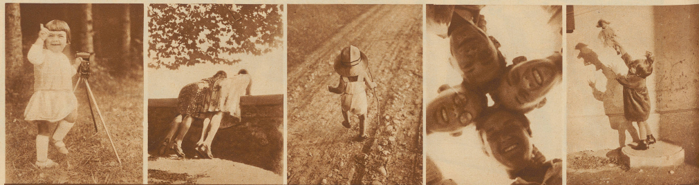
22. Früh übt sich was ein Meister werden will 23. Ueberrascht 24. Hänschen klein zieht allein ... 25. Ein fideles Kleeblatt 26. Mama: Lueg i han zwei Babi!