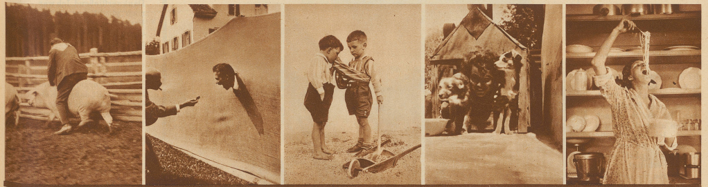
27. Die Sau als Pferd ist Goldes wert 28. Chumm, sä da, chumm! 29. Auch ein Freundschaftsdienst 30. Raum ist in der kleinsten Hütte! 31. Spaghetti!