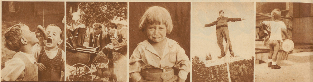
1. Wurstfischet: De Serbila — de Serbila! Hü Fritzli biß — Du muescht en ha! 2. Man schaut in die Zukunft 3. Rägewetter 4. Achtung! Verkehrspolizist 5. Er will seine Hosen trocknen