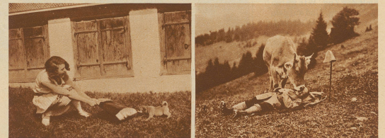
18. Nur feste druff 19. Ein Kuß in Ehren kann niemand verwehren