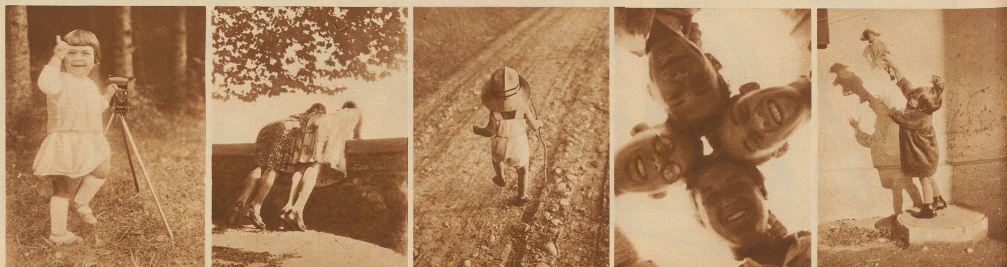
22. Früh übt sich was ein Meister werden will 23. Ueberrascht 24. Hänschen klein zieht allein... 25. Ein fideles Kleeblatt 26. Mama: Lueg i han zwei Babi!