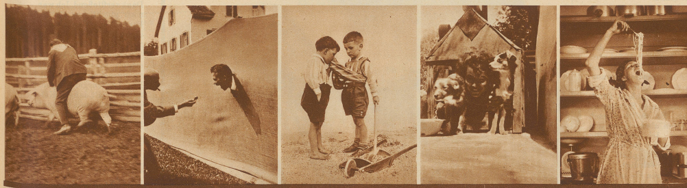
27. Die Sau als Pferd ist Goldes wert 28. Chumm, sä da, chumm! 29. Auch ein Freundschaftsdienst 30. Raum ist in der kleinsten Hütte! 31. Spaghetti!