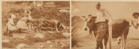
14. Sauglalt 15. Zurück zur Natur! Der Kuhschwanz als Puderquaste!