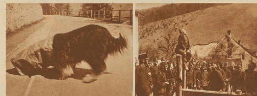
20. Bobby nascht Biskuit aus dem Papiersack 21. Der Regimentsaffe