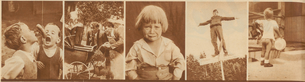
1. Würstfischer: De Serbila — de Serbila! Hü Fritzli biss — Du muschit en ha! 2. Man schaut in die Zukunft 3. Rägewetter 4. Achtung! Verkehrspolizist 5. Er will seine Hosen trocknen