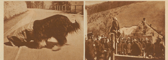
20. Bobby nascht Biskuit aus dem Papiersack 21. Der Regimentsaffe