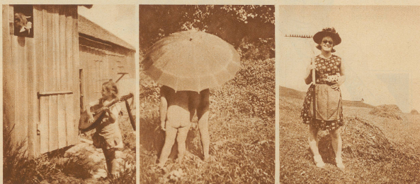
11. Das Ständchen 12. Ich spann mei Schirm und schiebe los, ja so ein Schirm ist ganz famos! 13. Gaißblüemli

Jetzt entscheidet die Gesamtheit unserer Leser, welches Bild hier das beste sei. Die Bildeinsender und die Einsender der Urteile: beide erhalten Preise nach nebenstehenden Bedingungen