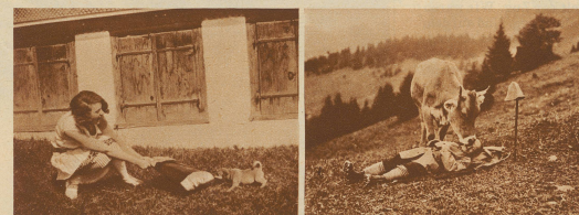
18. Nur feste druff 19. Ein Kuß in Ehren kann niemand verwehren