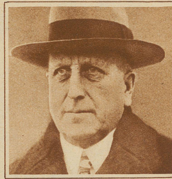
öffentlichung eines englisch-französischen Geheimvertrages angegeben. Hearst ist darauf nach der Schweiz gekommen