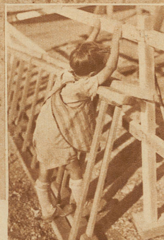
Ein kleiner Träumer

Hier ist's Pflicht der Eltern, einen gesunden Aerger zu empfinden oder einen kräftigen Protest loszulassen — aber, wenn möglich, nicht ohne dabei an die eigene Lausbubenzeit zurückzudenken