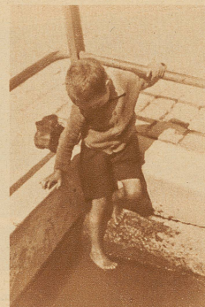
Hier kann sich's unmöglich um ein Reinigungsbad handeln!

Halt, Mutter! Gönn' deinem Buben die Freiheit und laß ihn austoben. Im Lausbuben steckt meist der Kern zu einem tüchtigen Menschen, und der Träumer von heute ist vielleicht der Dichter von morgen. Einen unverlierbaren Schatz aber wird sich jeder ins Alter hinüberretten, wenn er eine sonnige Kindheit genossen hat.