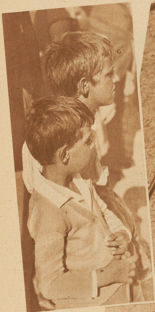
Zwei verschiedene Typen