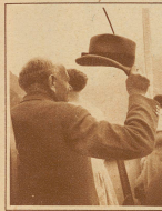
Eines wahren Patrioten stiller Gruß ans Rütli