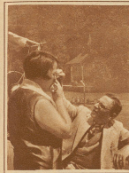
Die Mücke im Auge unterbricht für einen Augenblick das Glück des Beschauens