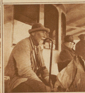
Wer so recht ins Beschaun verfallen ist, der vergißt seine Umgebung und träumt von kalten Unternehmungen oben an den Hängen des Urnerrocks