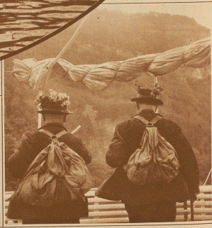
Aus U. S. A.? Aus England? Aus Berlin? Mit den Blumen am Hut? Nein! Das sind Mitglieder vom Männerchor Frohinn oder von der Schützengesellschaft Handorf, gute Eidgenossen auf alle Fälle!