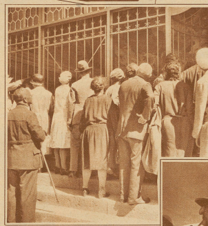
Andrang vor der Teilskapelle