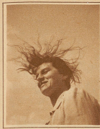
Wind um den Bubikopf!