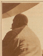
So ein wahrhafter Eidgenosse kann einem unter Umständen das ganze Panorama verdecken

«Das ist nun also das Rütli. Zwölf Aufsätze mußte ich auf dem Dortmunder Lyzeum über Schillers Wilhelm Tell machen. Der Anblick ist sauer verdient. Und nun regnet's noch obendrein!»