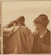
«Können Sie's lesen?» — Jawoll! — Dem Sänger Teils die Lykanose. — Das is der Schillerin, dem haben die Schwatzer dahingeterzt, weil ihnen Schiller mit dem Teils so ne prima Ware gelitert hats