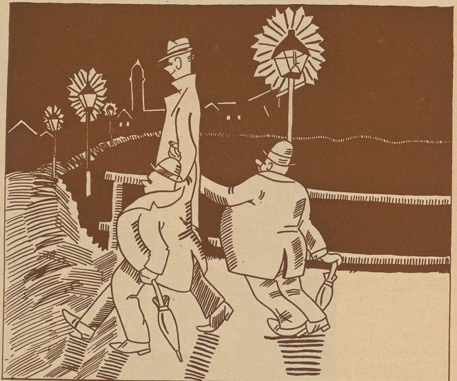
Illusion. Du, Heiri — wart e chli — laß z'erst de Tackelzug verbi

«Wie, Sie wollen gleich nach dem Essen baden?» «Warum denn nicht?» «Es ist gefährlich, Sie könnten ertrinken!» «Oh! Keine Sorge. Ich habe nur Fisch gegessen!»