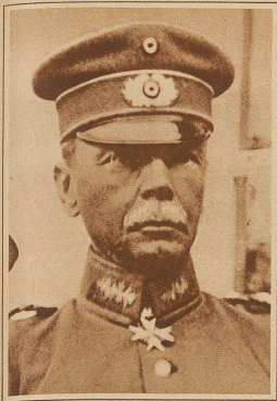
General von Seeckt, früherer Kommandant der deutschen Reichswehr, dessen neuestes Buch über Berufswehr und Landesverteidigung große Beachtung gefunden hat, kandidiert in den bevorstehenden Wahlen für den Reichstag. Von Seeckt gilt auch als einer der aussichtsreichsten Anwärter auf die dereinstige Nachfolge Hindenburgs als Reichspräsident