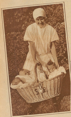
Verkauf? O nein! Es handelt sich hier keineswegs um einen Gang zum Markt, sondern nur um einen Spaziergang an die Sonne