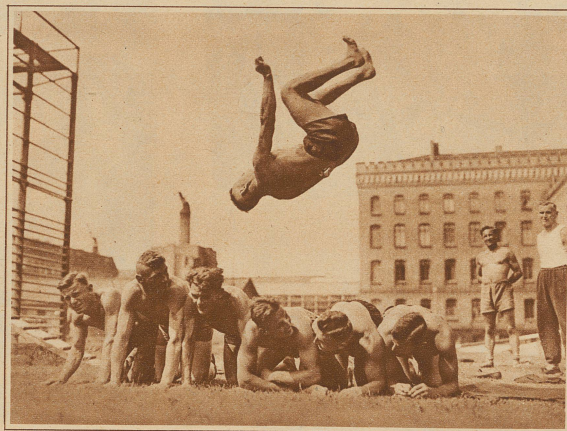
Aus der preußischen Polizeischule in Spandau. Die Schupo-Rekruten erhalten vor allem eine gründliche athletische Ausbildung, die ihnen bei ihrem spätern Dienst sehr zustatten kommt. Ein Salto über 6 Mann