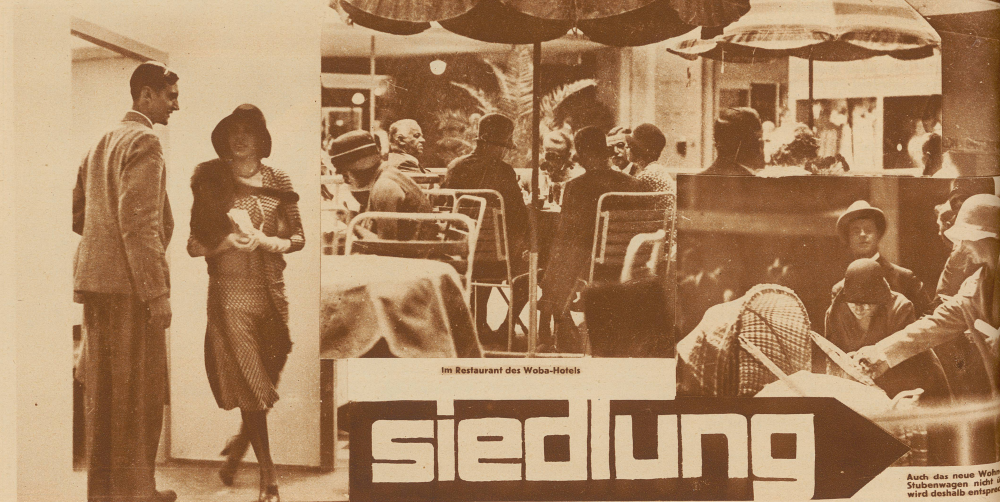
Im Restaurant des Woba-Hotels