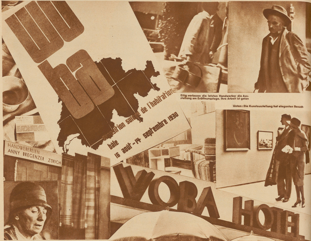
Eilig verlassen die letzten Handwerker die Ausstellung am Eröffnungstage. Ihre Arbeit ist getan