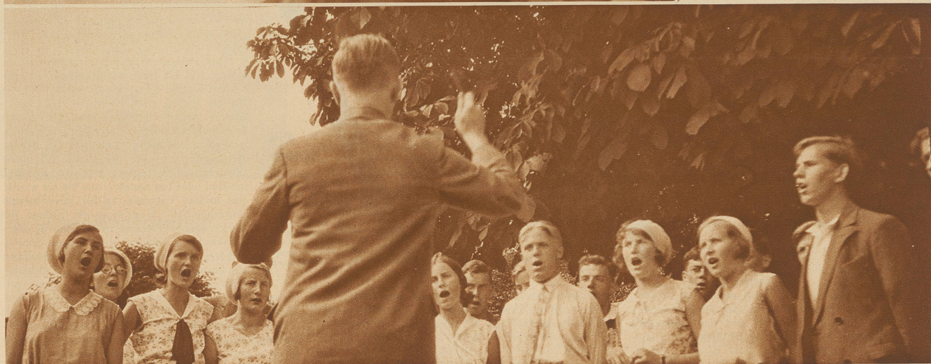
Untenstehendes Bild: Wettsingen. Wenn die Töne recht herauskommen sollen, muß man den Mund aufmachen