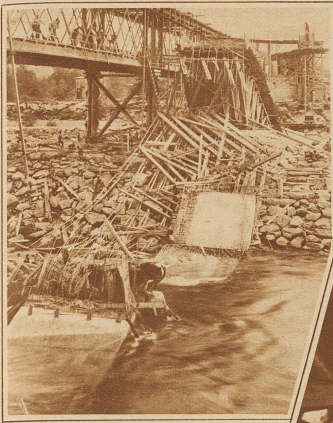
Nach dem Einsturz. Links steht die alte Eisenbrücke, die seinerzeit verschoben wurde, um der neuen Platz zu machen

Letzte Woche stürzte die im Bau befindliche Straßenbrücke über die Maggia zwischen Locarno und Ascona ein. Etwa 30 Arbeiter, die mit dem Betonieren des Schlußstückes beschäftigt waren, konnten sich im letzten Augenblick in Sicherheit bringen. Der Schaden wird auf über 200 000 Franken geschätzt.