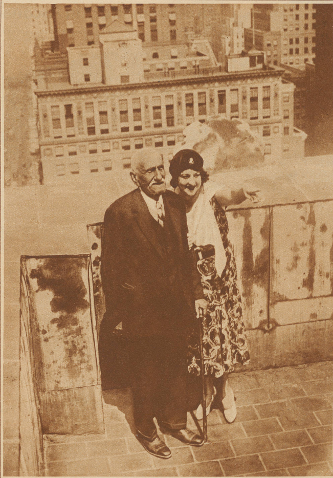
Bevor die Rundreise Zaro Aghas durch die Staaten beginnt, zeigt ihm eine Führerin der Antialkoholliga in New York von einem Wolkenkratzer aus die Stadt