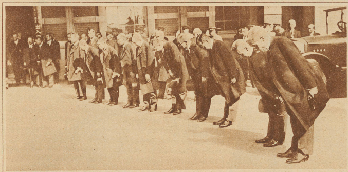
Der Kaiser kommt! Die devot sich verbeugenden japanischen Minister bei der Ankunft des Kaisers Hirohito auf dem Bahnhof von Tokio