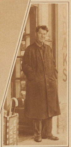
Der berühmte Schauspieler Alexander Moissi als Feriengast in Maloja