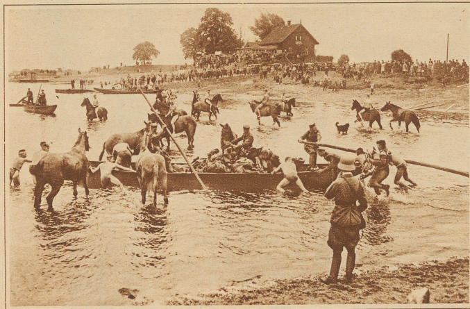
Stimmungsbild aus den Manövern der deutschen Reichwehr: Abteilungen des Reiterregiments 7 bei den Vorbereitungen zur Ueberquerung der Elbe bei Pretzsch