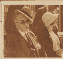
Bild rechts: Ein Kenner schöner Automobile und schöner Frauen; beides gab es in Luzern zu sehen