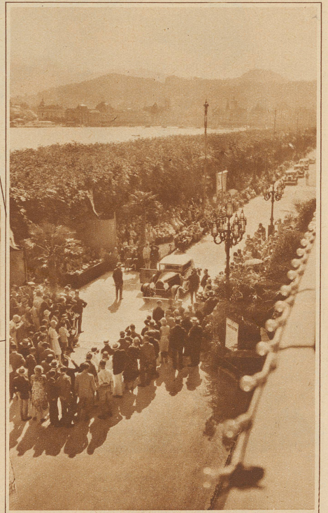
Die Vorführung der Automobile auf dem Nationalquai