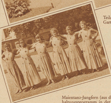
Maientanz-Jungfern (aus dem Unterhaltungsprogramm in der Festhütte)