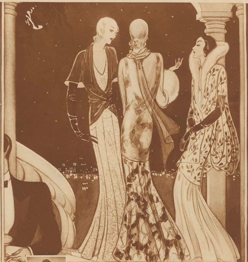
Vor dem Casino