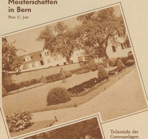
Teilansicht der Gartenanlagen