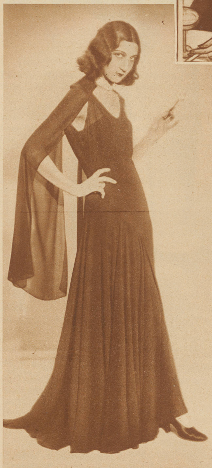
Flügel statt Aermel

In nervenaufreizender Monotonie überläßt der lockende Ruf der Croupiers das Geseumm in den Spielsälen. Schreiten, Flüstern, leises Klirren mischen sich mit Wolken der erdenklichsten Parfums zu prickelnder Atmosphäre. * In Ländern, die weniger auf moralische Geste ihrer Kursäle, als auf gute Einnahmequellen halten, bilden die «Casinos» den Brennpunkt sommerlichen Fremden- und mondänen Verkehrs. Wohl gibt es auch Casinos, die wie in Trouville mit allem ausgestattet sind, was der verwöhnte Gast an Spielsälen, Theater, elegantem Restaurant, Bar usw. erwarten darf und die dennoch auch im Reiseanzug betre-