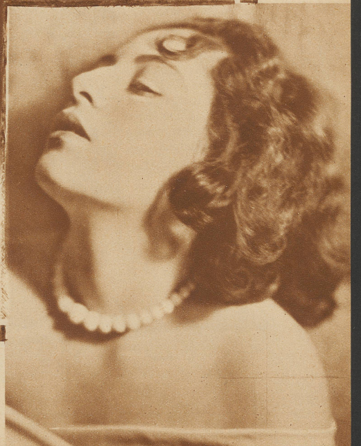
Mit Kette? – Ohne Kette?