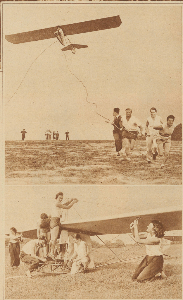
Die Flugstudentinnen beim Prüfen der Verspannung

Professor Calmette verteidigt vor dem mikrobiologischen Kongreß in Paris sein Antituberkulose-Serum, dessen Verwendung in Lübeck den Tod von über 60 Kindern zur Folge hatte. Calmette sagt, es könne sich in Lübeck nur um ein verhängnisvolles Irrtum bei der Anwendung handeln, da in Frankreich bis jetzt über eine Viertelmillion Kinder ohne die geringste Schädigung geimpft worden seien