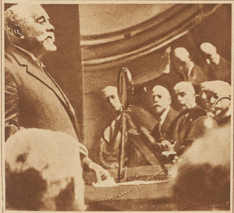
Professor Calmette verteidigt vor dem mikrobiologischen Kongress in Paris sein Antituberkulose-Serum, dessen Verwendung in Lübeck den Tod von über 60 Kindern zur Folge hatte. Calmette sagt, es könne sich in Lübeck nur um ein verhängnisvolles Irrtum bei der Anwendung handeln, da in Frankreich bis jetzt über eine Viertelmillion Kinder ohne die geringste Schädigung geimpft worden seien